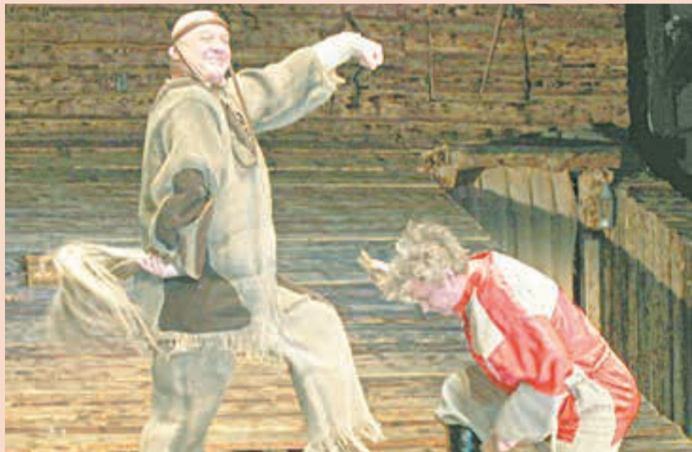
ДК им. Солдатова, 8 октября, 19:00