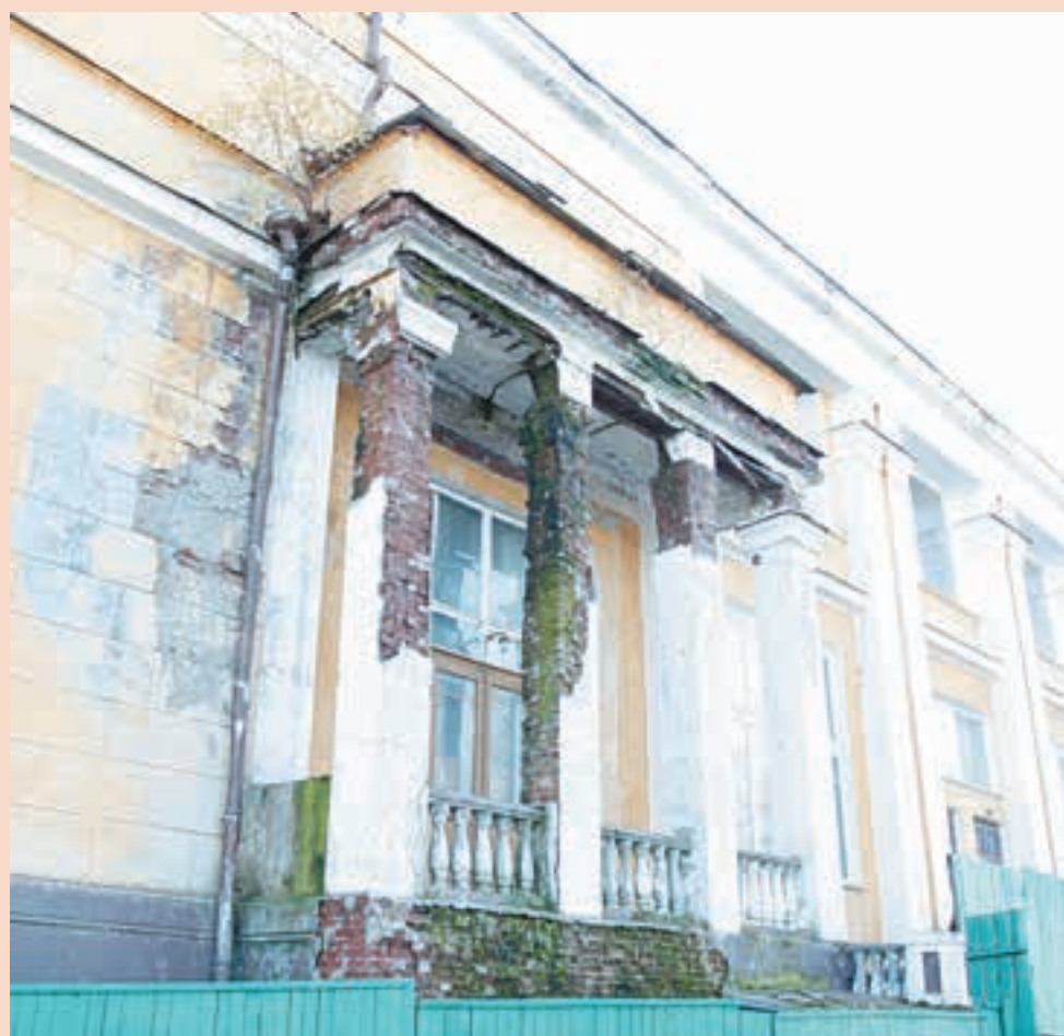
Согласно госпрограмме «Культура Пермского края», в 2016 году завершится реконструкция Речного вокзала для современного использования