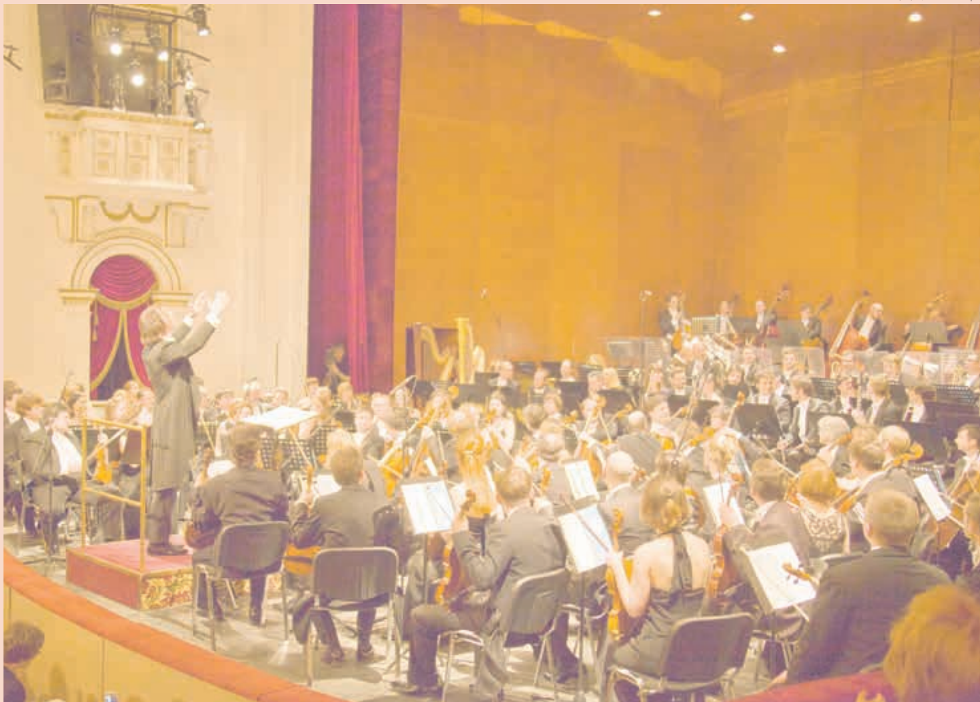
Как всегда, на закрытии Дягилевского фестиваля выступит большой фестивальный оркестр под управлением Теодора Курентзиса. Планируется Третья симфония Малера