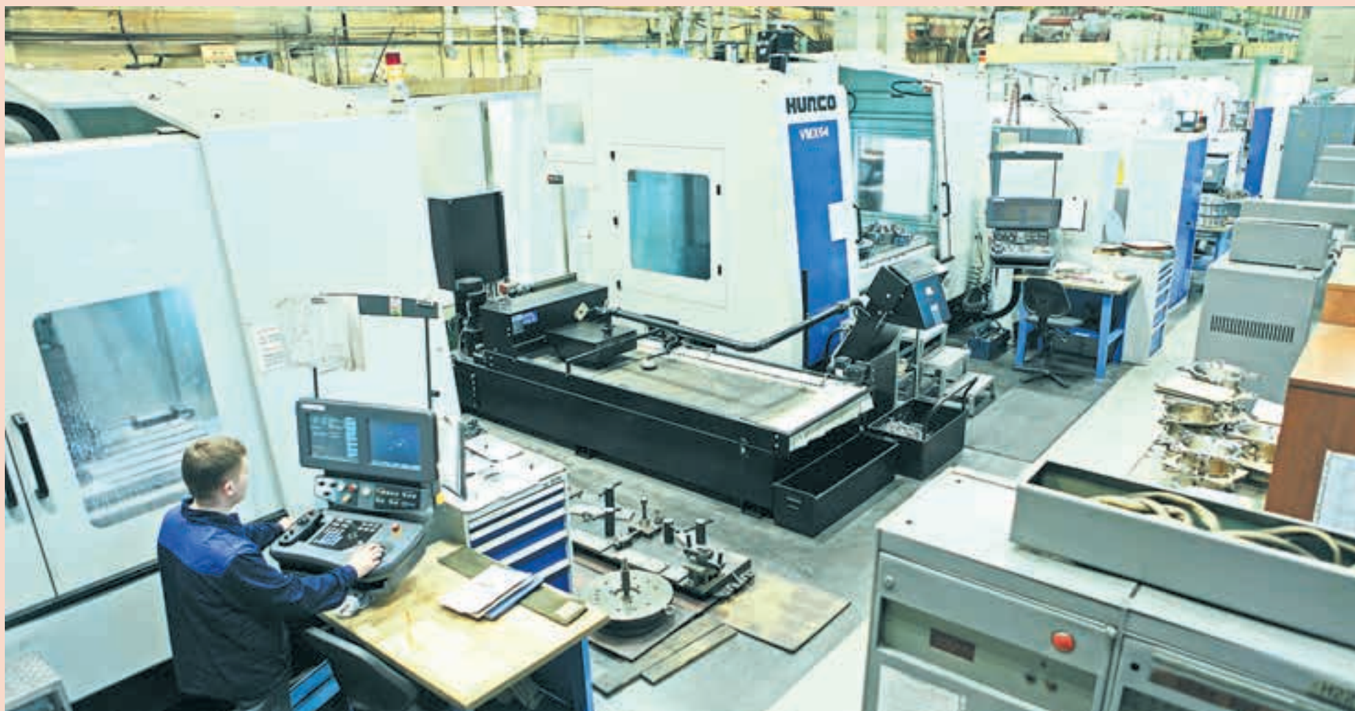
Механосборочный цех ОАО «Протон-ПМ», участок прогрессивного оборудования

Суммы, оговоренные в конечном варианте концепции, весьма существенны и могли бы, наверное, при грамотном применении что-то изменить в инновационном климате края. Так, согласно последнему варианту концепции, с 2014 по 2020 год в инновационное направление в целом планируется инвестировать 10,9 млрд руб. При этом из краевого бюджета предполагается выделить 7,4 млрд руб. Ещё 3,2 млрд руб. планируется привлечь из внебюджетных источников — от заинтересованных в инновациях предприятий. Вклад федерального бюджета в реализацию концепции ожидается небольшой — 271 млн руб. за семь лет.