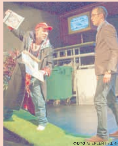
«Сцена-Молот», 7 и 8 сентября, 20:00

Водоворот безбашенного придуривания и фантазмагорических ситуаций, в который стремительно втягивается публика, чтобы, отсмеявшись, задуматься о морали и прочих важных для собственной жизни вещах.