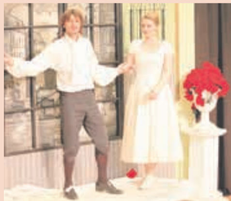
Пермский театр оперы и балета, 10 и 11 сентября, 19:00