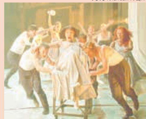
Театр-Театр, 6 сентября, 19:00; 7 и 8 сентября, 18:00

Хореограф-постановщик — Ирина Ткаченко. В её версии история злосчастного Акакия Акакиевича и его сложных взаимоотношений с шинелью превращается в притчу о природе человеческого страха, увлекательную, как мистический триллер, и эстетичную, как петербургские фасады, за которыми скрываются тайны героев гоголевских повестей.