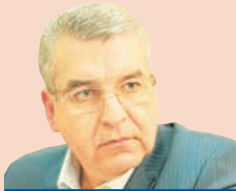
Игорь Сапко, глава ПЕРМИ