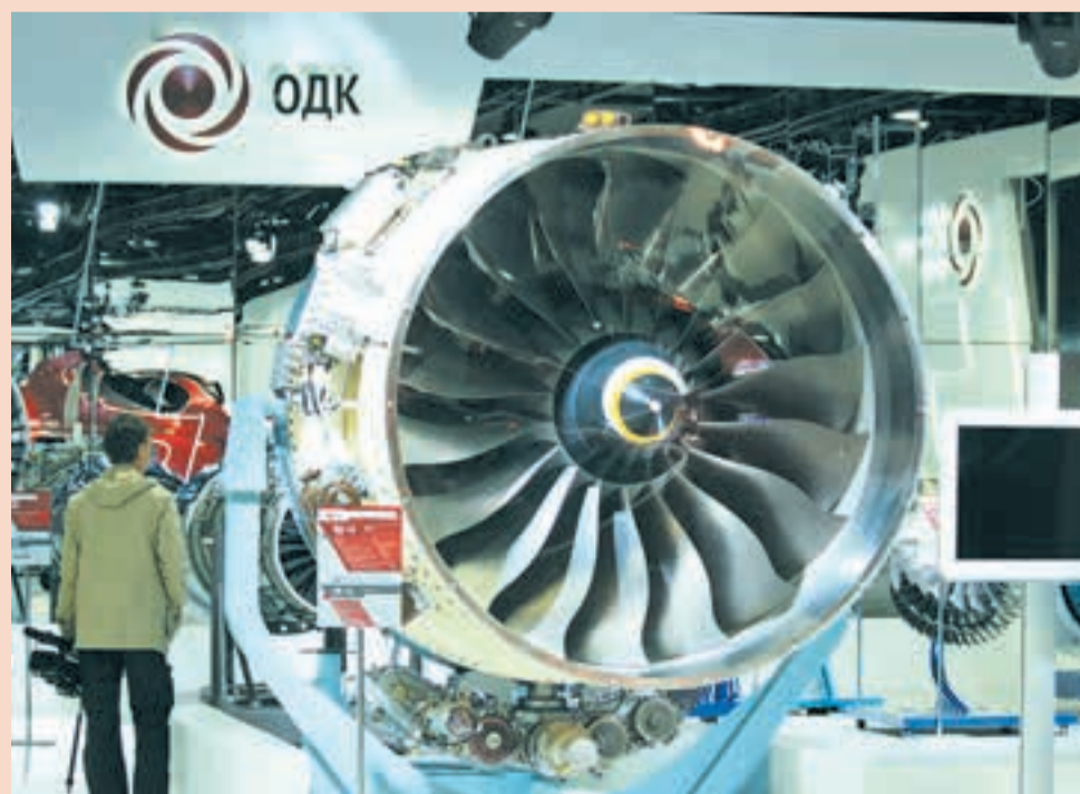
Двигатель ПД-14 впервые был представлен российским авиаторам в полном размере

Пермский моторный завод является головным предприятием ОДК по серийному производству, сборке, испытаниям и послепродажному обслуживанию ПД-14, и в рамках авиасалона пермские моторостроители провели его масштабную презентацию. По информации ОДК, никаких решений в её ходе не принималось, так как круг «слушателей» был весьма обширным — фактически, все участники выставки.