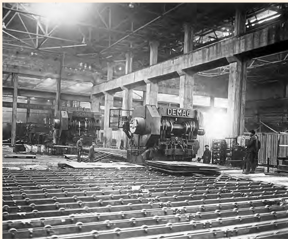
Ножницы для резки толстых листов