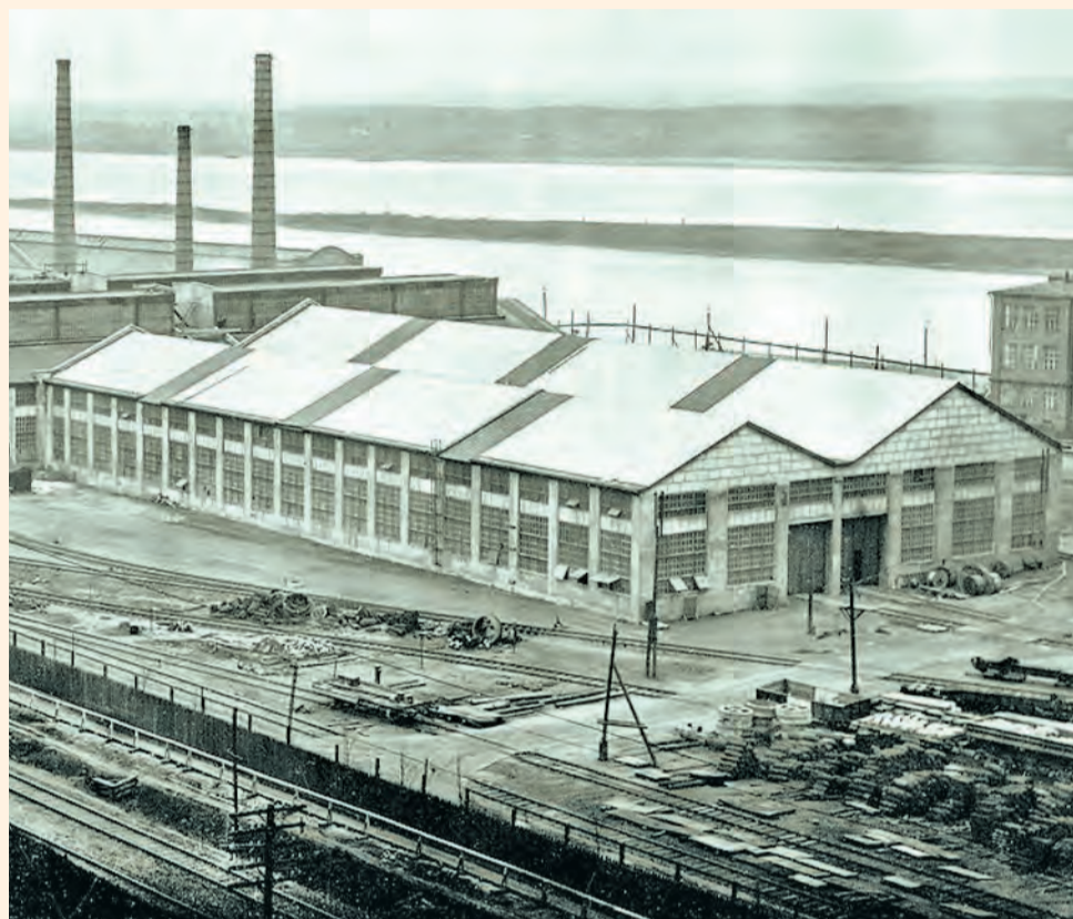
Листопрокатный цех. 1935 год

Решение о закрытии листопрокатного цеха было трудным, но неизбежным. Убыточное производство на устаревшем оборудовании с выпуском неконкурентоспособной продукции — вчерашний день. Нам нет смысла конкурировать с гигантами металлургии в простейших сталях и продуктах. «Мотовилиха» — завод не только специального машиностроения, но и специальной металлургии. Наш приоритет — производство спецсталей, в которое запланировано инвестировать около 300 млн руб. в течение ближайших трёх лет. ■