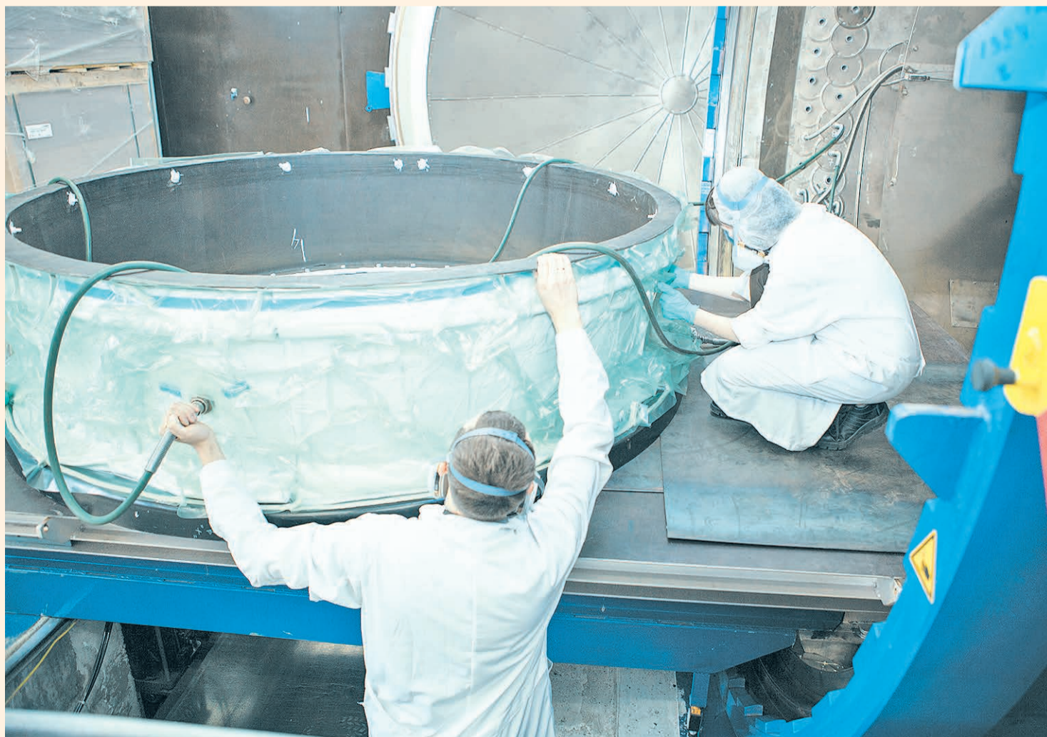
Изготовление переднего корпуса двигателя ПД-14 — «участника» авиасалона «МАКС-2013»

Небольшая лаборатория, буквально «напичканная» ультрасовременной техникой, и в самом деле осуществила некий «скачок» из начала 1990-х годов в XXI век.