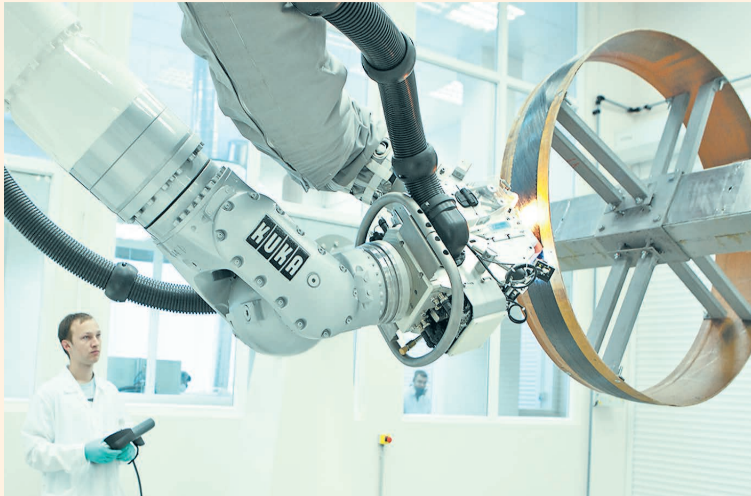
Роботизированная установка уже настроена на производство первых узлов мотогондолы ПД-14