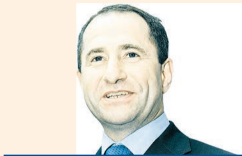
Михаил Бабич , полномочный представитель президента РФ в Приволжском федеральном округе

О программе обеспечения доступности внутренних региональных перевозок пассажиров воздушным транспортом в Приволжском федеральном округе