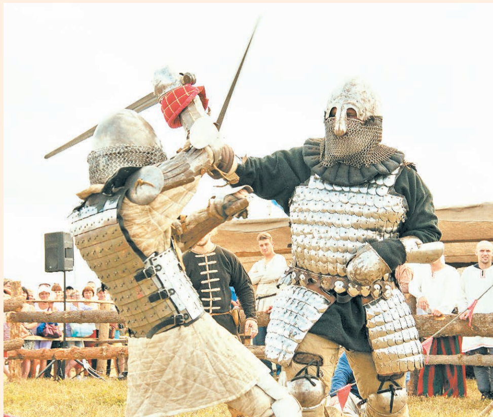
Чердынский район, село Камгорт, 9–11 августа

Любители активного отдыха смогут отправиться в приключение по Камгортским тропам, таящим много неизвестного и удивительного, поучаствовать в экологическом конкурсе биваков, сразиться на мечах и пострелять из лука.