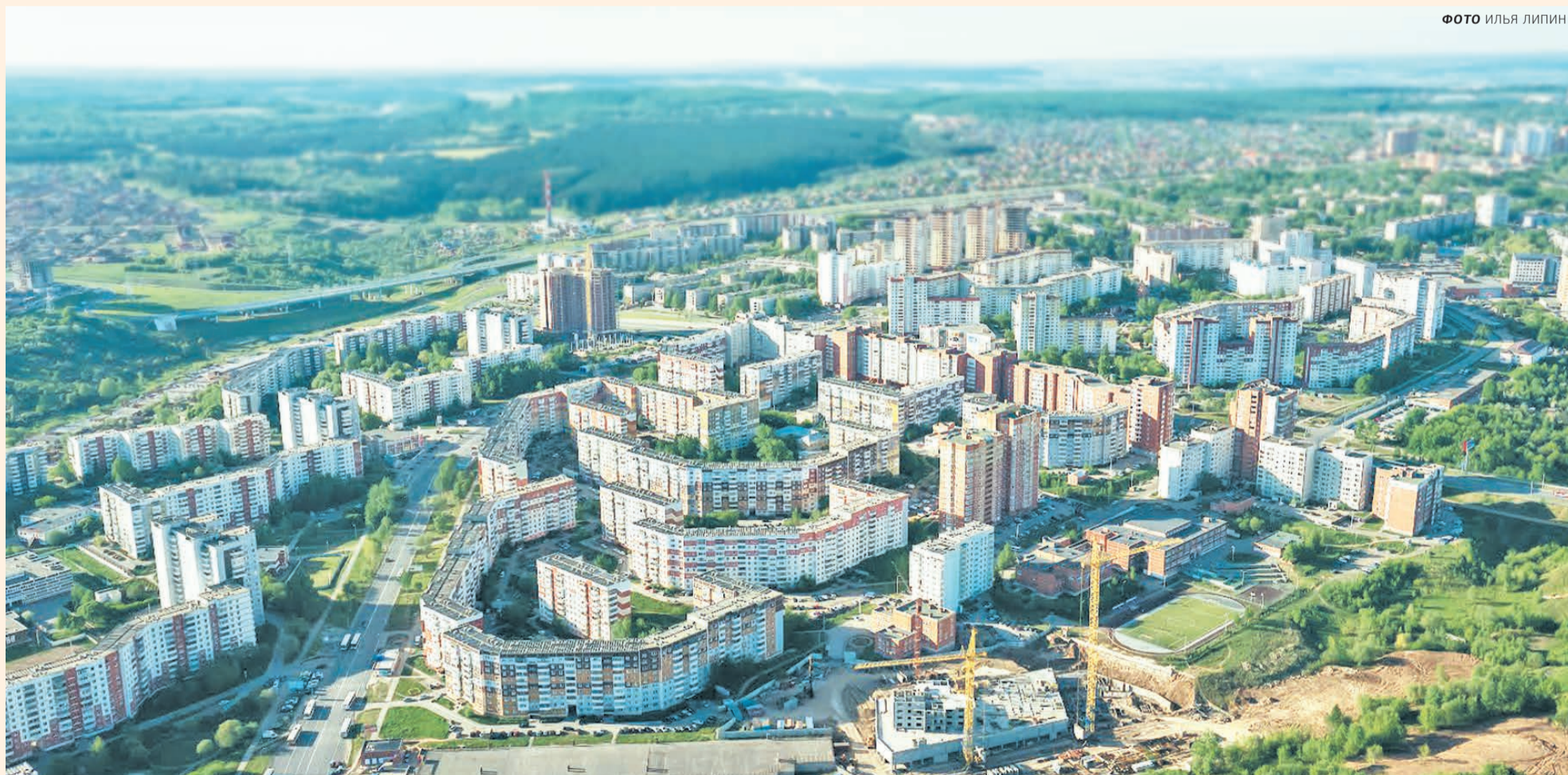
Микрорайон Садовый — типичная для советских времён многоэтажная и хаотичная застройка