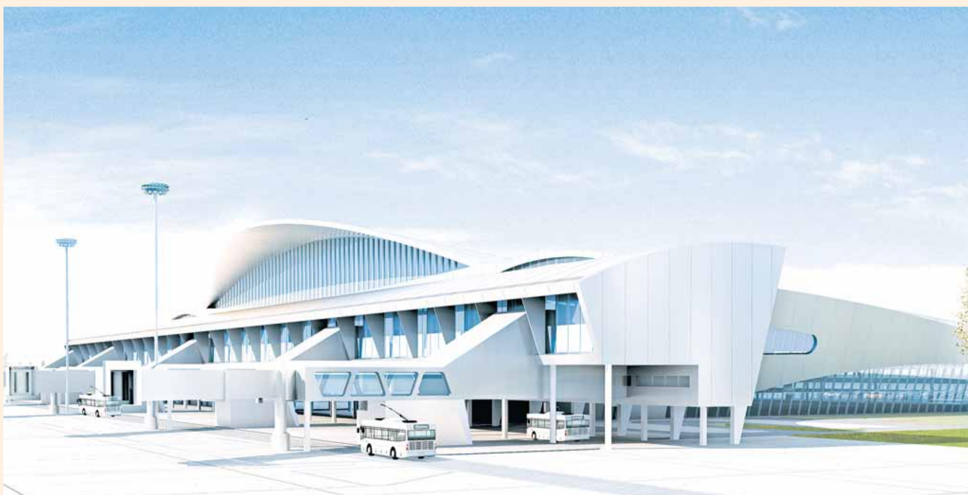
Проект нового здания аэровокзала в самарском аэропорту Курумоч

Жаль, что эту простую истину понимают явно не все... ■