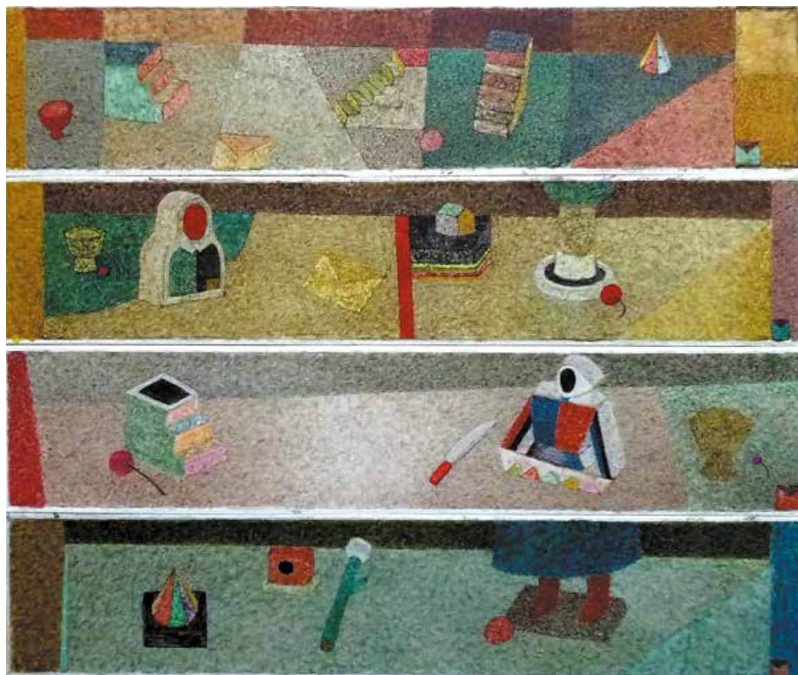
Композиция с супрематическими фигурами 1, 2, 3, 4