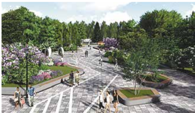
Проект ремонта сада им. Миндовского

Свой голос за наиболее понравившийся проект могут отдать не только пермяки — за будущее своих городов голосует вся страна. Шансы повлиять на итоговый результат ещё остаются — выбор можно сделать до конца апреля.