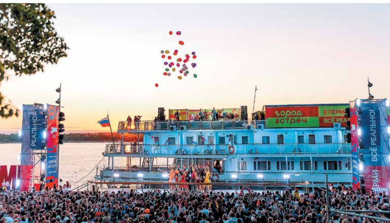
Выступление группы «Чайф» на фестивале «Город встреч»

А относиться к Пермскому театру оперы и балета как-то по-особенному я себе запретила. Мне кажется, что в первое время после того, как я пришла в министерство, театр получал даже меньше внимания, чем до меня. Сейчас я, как мне кажется, смогла выравнять подходы. КЭ