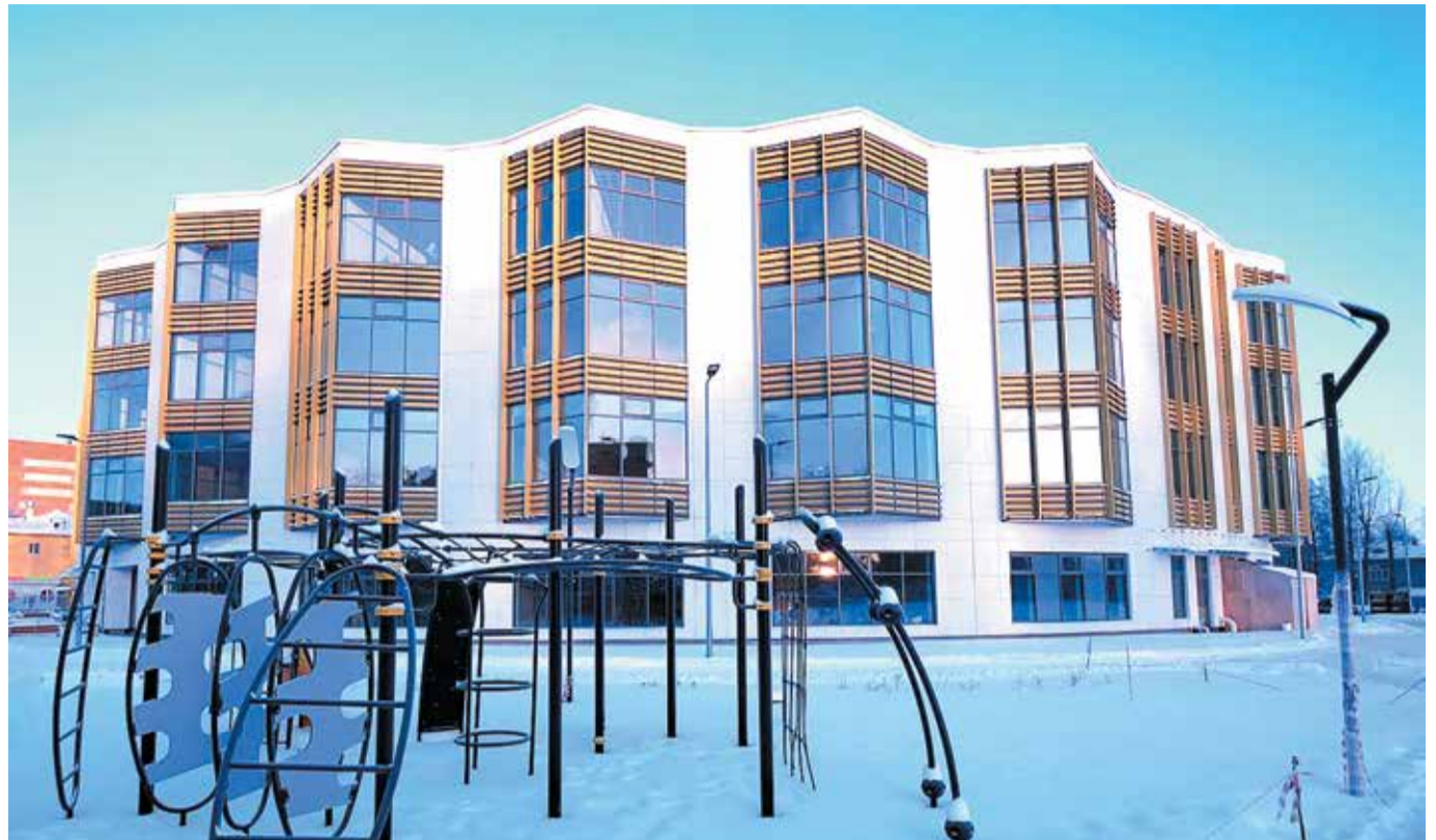
Здание краевой музыкальной школы

Что касается летнего фестиваля «Город встреч», который запомнился и полюбили все, то недавно в ходе прямого эфира губернатор Дмитрий Махонин сообщил, что прорабатывается возможность часть мероприятий