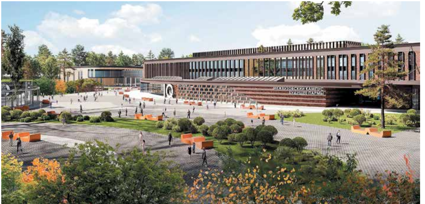
ФОТО ЭСКИЗЫ ИЗ ПРОЕКТНОЙ ДОКУМЕНТАЦИИ

“ В составе кампуса — учебно-лабораторный корпус с технопарком, конгресс-холл с концертным залом, физкультурно-оздоровительный комплекс и другое