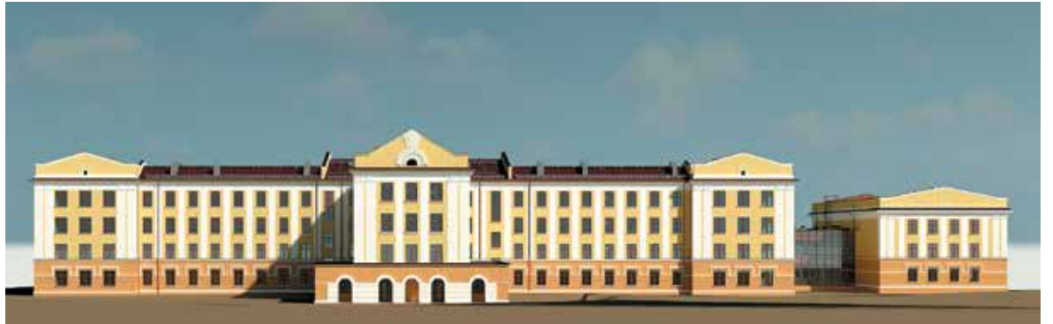
ФОТО ЭСКИЗЫ ИЗ ПРОЕКТНОЙ ДОКУМЕНТАЦИИ

Проектная документация реконструкции здания на Уральской, 110 успешно прошла историко-культурную экспертизу и получила согласование Государственной инспекции по охране объектов культурного наследия. Ранее на этом месте стояло историческое здание швейцарского архитектора Ханнеса Мейера. Хотя официально оно не являлось объектом культурного наследия, власти решили воссоздать его облик в том же виде.