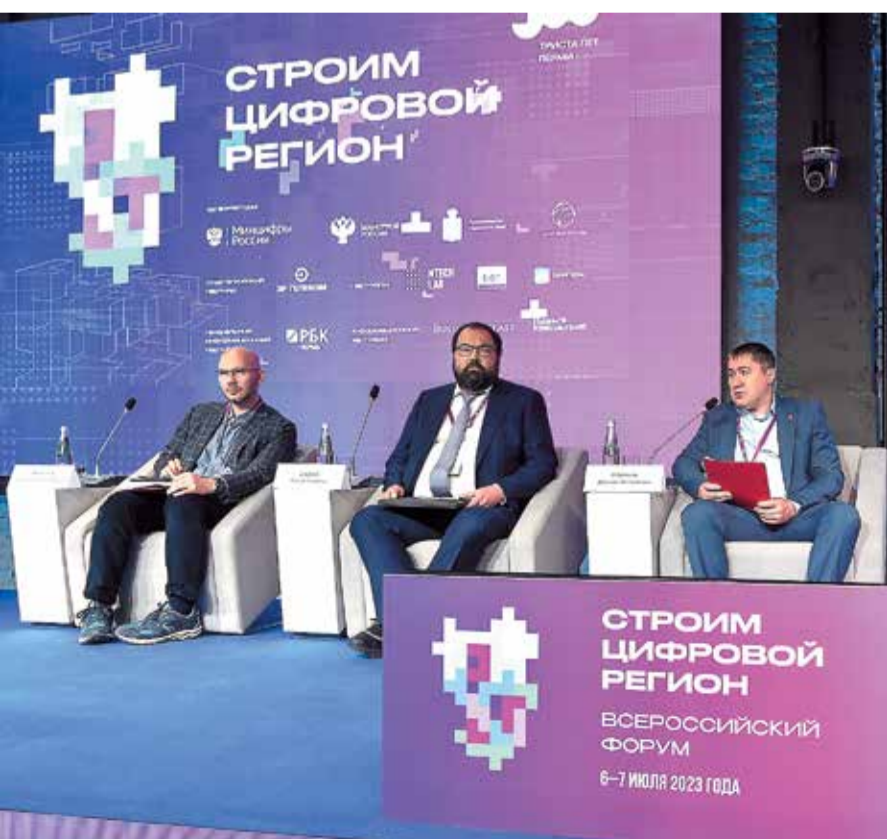
СТРОИМ ЦИФРОВОЙ РЕГИОН ВСЕРОССИЙСКИЙ ФОРУМ 6-7 ИЮЛЯ 2023 ГОДА

Ранее сообщалось, что новый планетарий будет иметь купол диаметром 19 м, научную библиотеку, многофункциональное пространство для выставок, лекций и концертов. Количество посадочных мест — не менее 140. Построить его инвестор собирался в 2024 году.