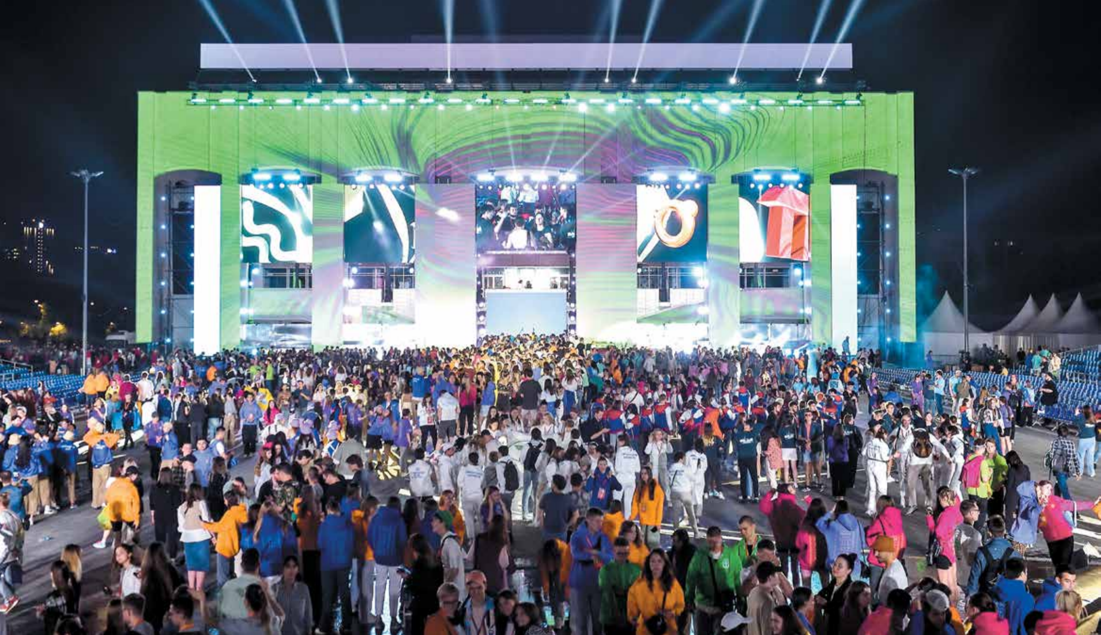
ФОТО ИВАН ПЕТРОВ