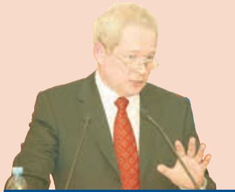
Виктор Басаргин, губернатор Пермского края

Губернатор прокомментировал увольнение Марата Гельмана