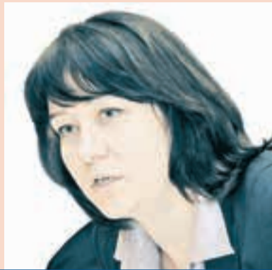
Лилия Ширяева, ЗАМЕСТИТЕЛЬ ПРЕДСЕДАТЕЛЯ ЗАКОНОДАТЕЛЬНОГО СОБРАНИЯ ПЕРМСКОГО КРАЯ

Кто или что мешает построить в Пермском крае 1 млн кв. м?