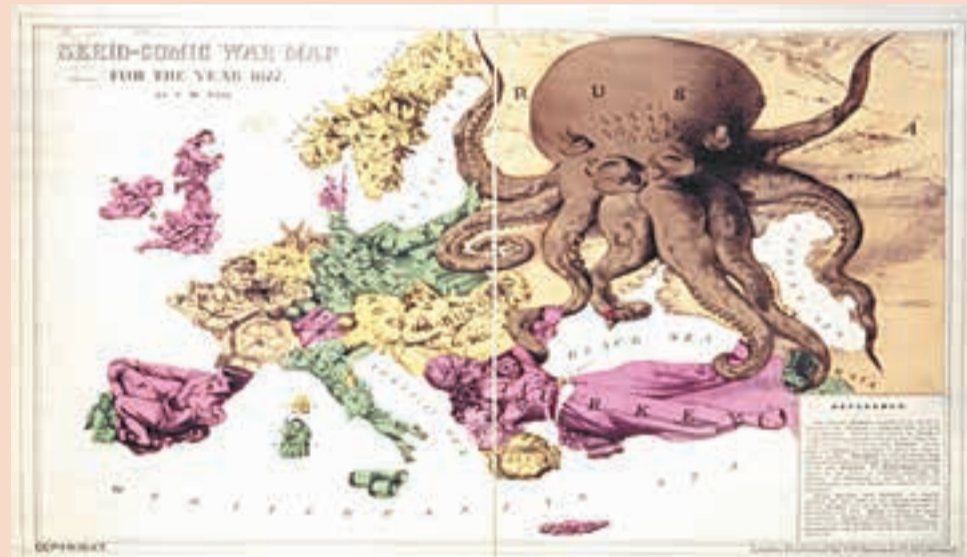
Так Россию политические карикатуристы изображали в XIX веке