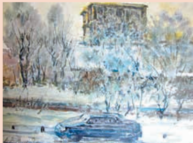
В. Кузин. «Морозное утро»

В произведениях живописи, скульптуры, графики и декоративно-прикладного искусства образ современного города получает сугубо индивидуальное толкование. Кто-то славит прогресс и любуется новыми здания-