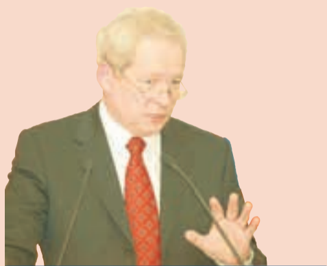
Виктор Басаргин, губернатор Пермского края

Губернатор Пермского края разошёлся с Маратом Гельманом во взглядах на искусство