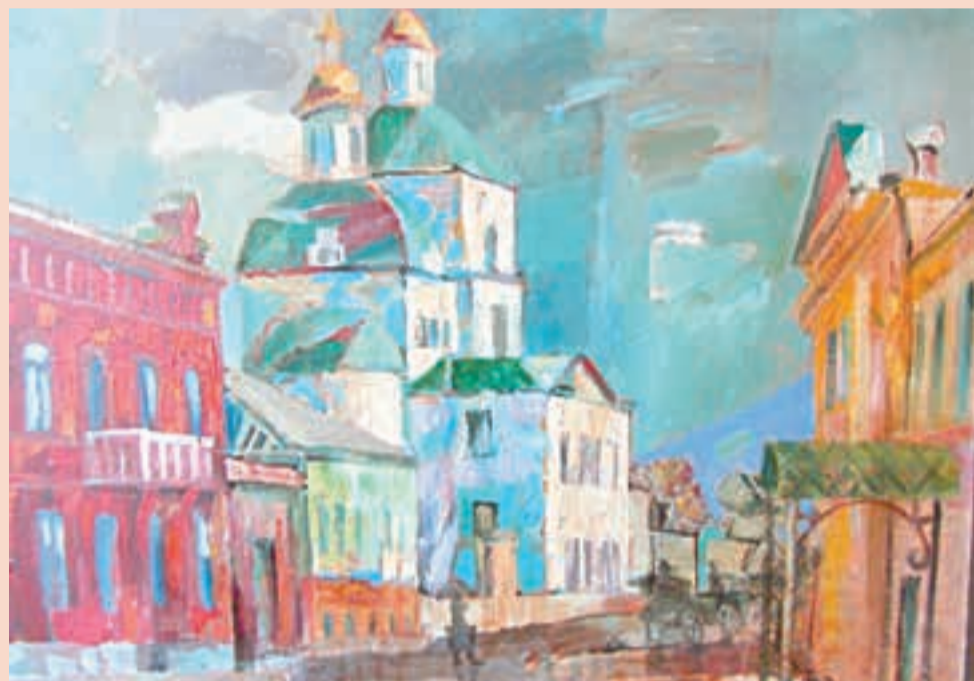
А. Гнётов. «Старая Пермь после дождя»