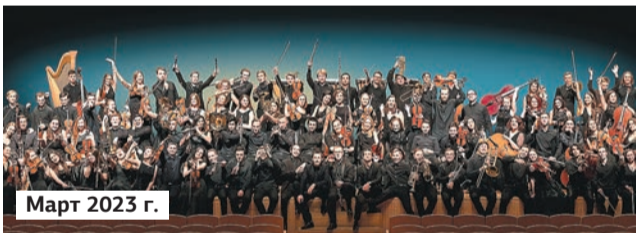
Амбассадор фестиваля — Российский национальный молодёжный симфонический оркестр (РНМСО) — коллектив блистательных молодых музыкантов. «Их отличает особая энергетика. Искусства без страсти не бывает, и каждый из них, даже сидящий за последним пультом скрипок, выкладывается на 150% даже на репетициях. Они играют великую музыку с колоссальным удовольствием. И мне это по душе», — признаётся Денис Мацуев, говоря о музыкантах молодёжного оркестра.