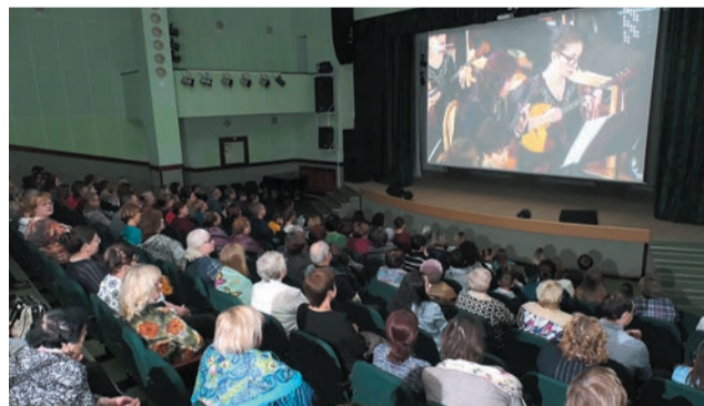
Виртуальный концертный зал в Добрянке

Согласно плану развития сети ВКЗ к концу 2025 года в Пермском крае будут работать 54 филиала, из них 18 — планируются к открытию в рамках национальной программы «Культура», 36 — в посёлках и сёлах края в рамках региональной программы при поддержке Министерства культуры Пермского края.