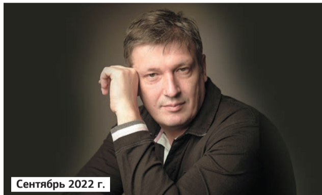
Сентябрь 2022 г.

Заслуженный артист России Борис Березовский, фортепиано