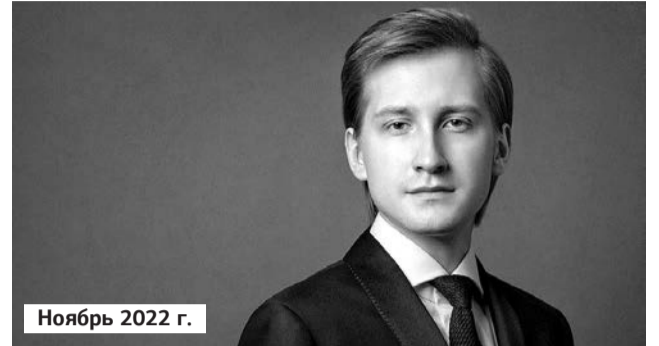
Ноябрь 2022 г.

Екатерина Мечетина, заслуженная артистка России, солистка Московской филармонии, лауреат международных конкурсов, фортепиано: — Органный зал Пермской филармонии, где я неоднократно выступала, — один из лучших камерных залов нашей страны. Великолепный, изумительный рояль. Главное достоинство Перми — это публика: потрясающая, тёплая, горячая, понимающая, образованная, любящая. И каждый раз выходить на сцену Пермской филармонии — это и огромная ответственность, и несравненное удовольствие.