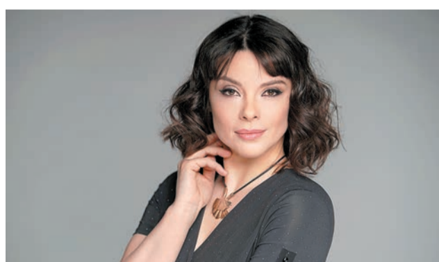
Октябрь 2022 г.

Заслуженный артист России Борис Березовский, фортепиано