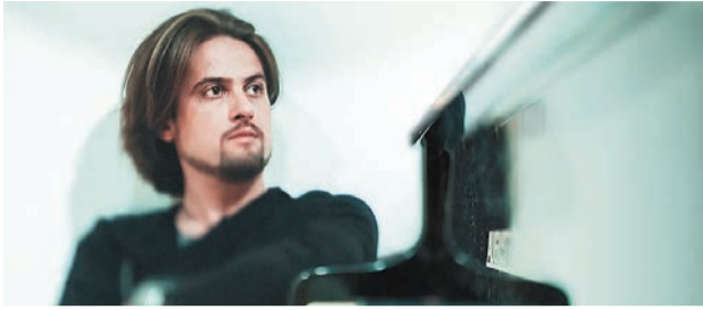
«Погружение» Евгений Соколовский, фортепиано 6 января 2023 г. (6+)