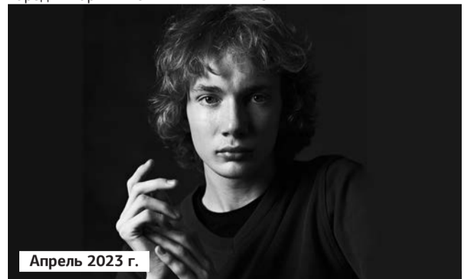
Апрель 2023 г.

Советский и российский актёр театра, кино и телевидения, театральный педагог, ректор Театрального института им. Б. Щукина, народный артист России Евгений Князев