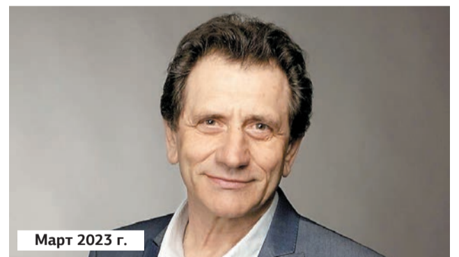
Март 2023 г.

Актёр театра и кино, заслуженный артист России Даниил Спиваковский