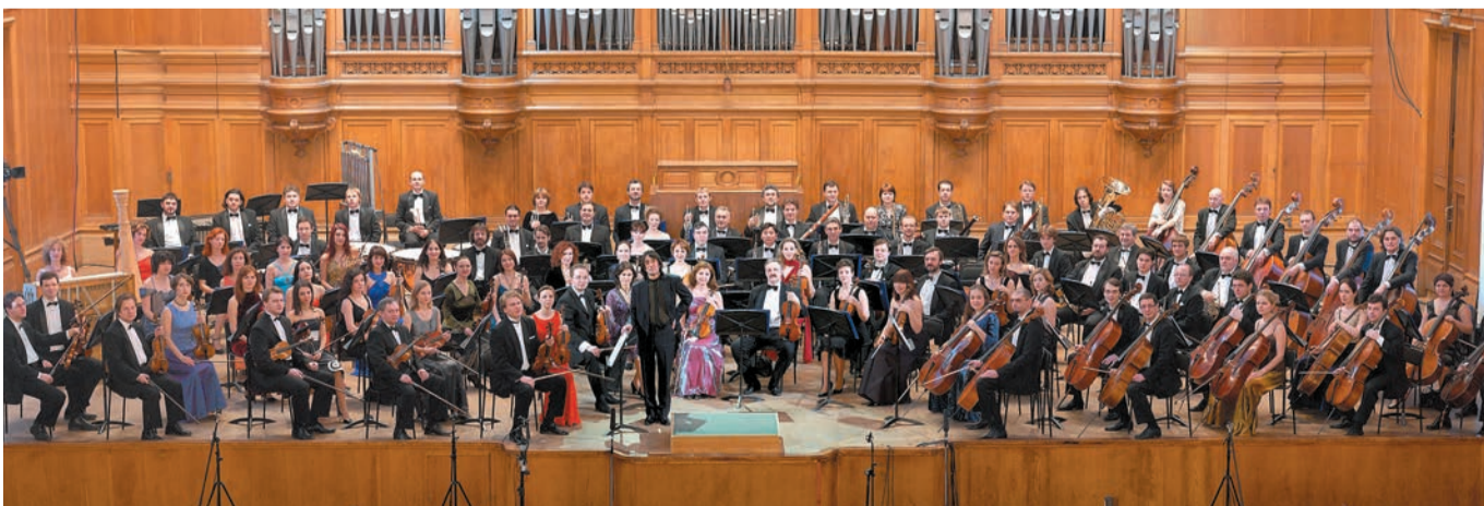
ОТКРОЕТ СЕЗОН ГОСУДАРСТВЕННЫЙ СИМФОНИЧЕСКИЙ ОРКЕСТР «НОВАЯ РОССИЯ» ПОД УПРАВЛЕНИЕМ НАРОДНОГО АРТИСТА СССР И РОССИИ ЮРИЯ БАШМЕТА (6+) 11 ОКТЯБРЯ, ДК ИМ. СОЛДАТОВА

Контент предстоящего сезона насыщен и разнообразен. Свою весомую лепту в нашу разнообразную афишу внесут симфонические и камерные оркестры России и дружественных стран. Слушателей ждут встречи с Государственным симфоническим оркестром «Новая Россия» под руководством народного артиста СССР и РФ Юрия Башмета; Национальным филармоническим оркестром России под управлением народного артиста СССР Владимира Спивакова; Российским национальным молодёжным симфоническим оркестром (РНМО); Государственным камерным оркестром Республики Беларусь; Роговым оркестром Санкт-Петербурга; Камерным оркестром В-А-С-Н — The Soloists of Russia (Екатеринбург); Камерным оркестром Российской академии музыки им. Гнесиных; Камерным оркестром Antonio-orchestra.