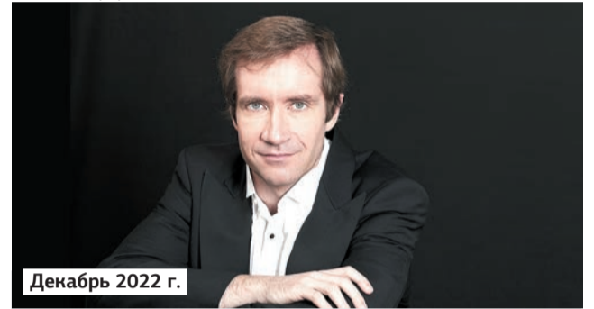
Декабрь 2022 г.