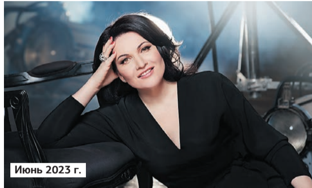
Июнь 2023 г.

Специальный гость фестиваля — Хибла Герзмава (сопрано), солистка Московского музыкального театра им. Станиславского и Немировича-Данченко, народная артистка России, народная артистка Абхазии, лауреат Государственной премии РФ