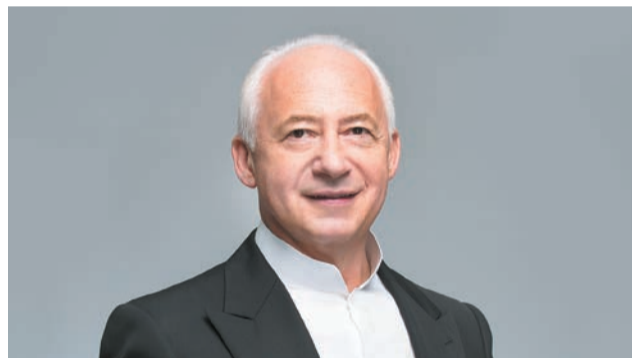
Владимир Спиваков, народный артист СССР, артист мира ЮНЕСКО: — Могу признаться, положила руку на сердце: Пермская филармония — одна из лучших региональных филармоний России. Самое главное — мы приезжаем в Пермскую филармонию, как домой, здесь такая чудесная и воспитанная публика.

Специальный гость фестиваля — Хибла Герзмава (сопрано), солистка Московского музыкального театра им. Станиславского и Немировича-Данченко, народная артистка России, народная артистка Абхазии, лауреат Государственной премии РФ