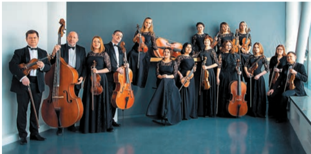
Заккрытие фестиваля Симфонд-оркестр «Времена года Чайковского» Камерный оркестр В-А-С-Н — The Soloists of Russia (Екатеринбург) Дирижёр — Николай Усенко Группа Classy Jazz под управлением Олега Матвеева (Москва) 13 января 2023 г. (6+)