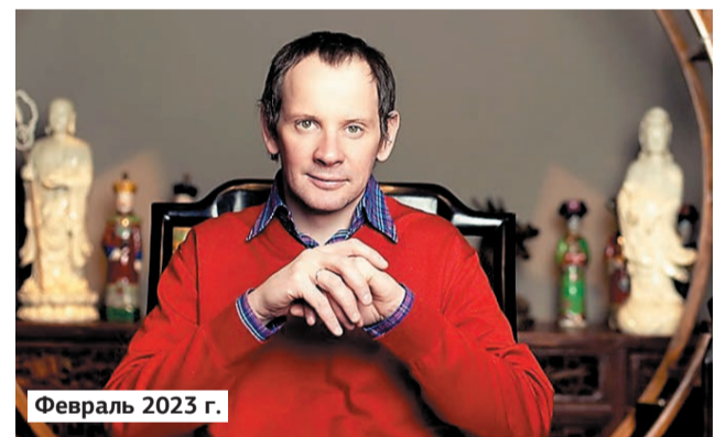
Февраль 2023 г.

Николай Луганский, народный артист России, солист Московской филармонии, лауреат Государственной премии России, фортепиано: — Пермская аудитория — одна из самых любимых в стране, и мне важно выступать для неё в полную силу и в полном объёме. Выражаю огромную благодарность Пермской филармонии за наше многолетнее сотрудничество.