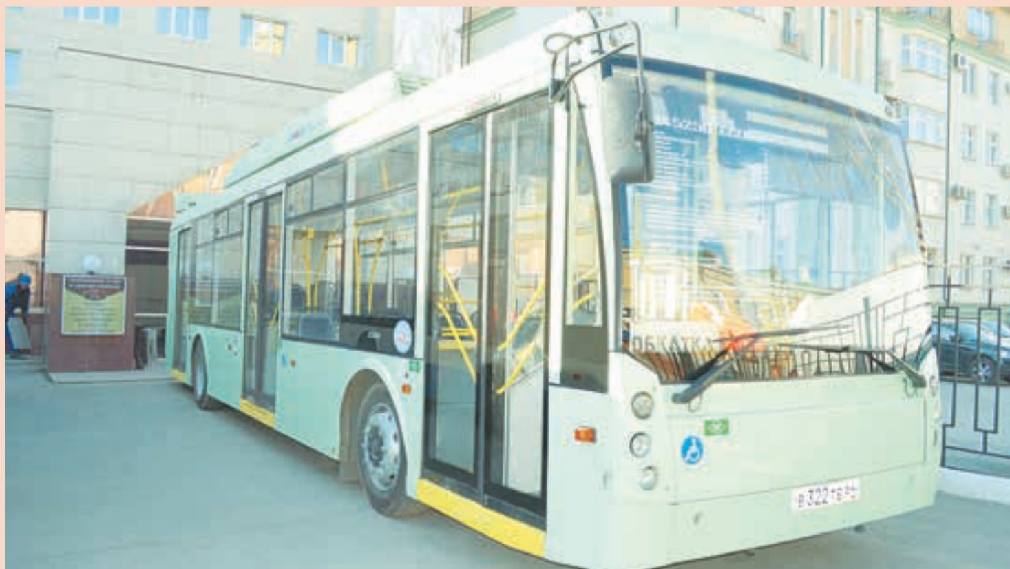
«Пермгорэлектротранс» презентовал экобус, работающий на метане. Предполагается, что он в три раза экономичнее автобусов, работающих на дизельном топливе, и в полтора — стандартных троллейбусов. По Перми экобус будет курсировать в экспериментальном режиме до 15 июня

— Поэтому горожане предпочитают пересаживаться на личные автомобили. Это, конечно, усугубляет проблему перегруженности транспортной сети. Чтобы изменить ситуацию, мы намерены скорректировать маршрутную сеть, избавиться от дублирующих маршрутов и переосмыслить трамвайную сеть. ■