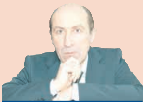
Эмиль Маркварт, президент Европейского клуба экспертов местного самоуправления

По целому ряду направлений город является одним из наиболее прогрессивных в России