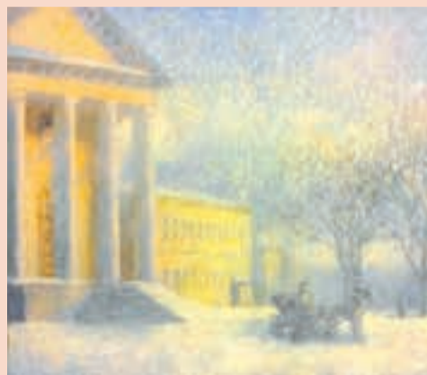
«У кафедрального собора», 2013

«Пермь: близкое-далёкое» — совместный проект художника Константина Николаева и галереи «Марис-Арт» к 290-летию Перми.