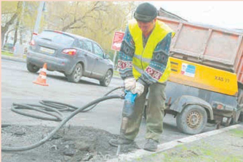
Компании, выигравшие тендеры администрации Перми по выбору подрядчиков для текущего ремонта и содержания городских улиц