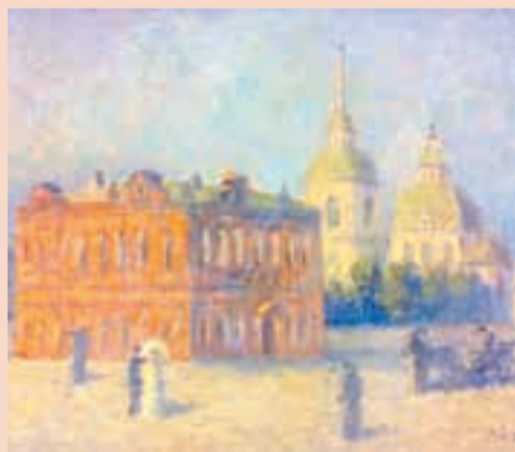
«Прогулки по старой Перми», 2013