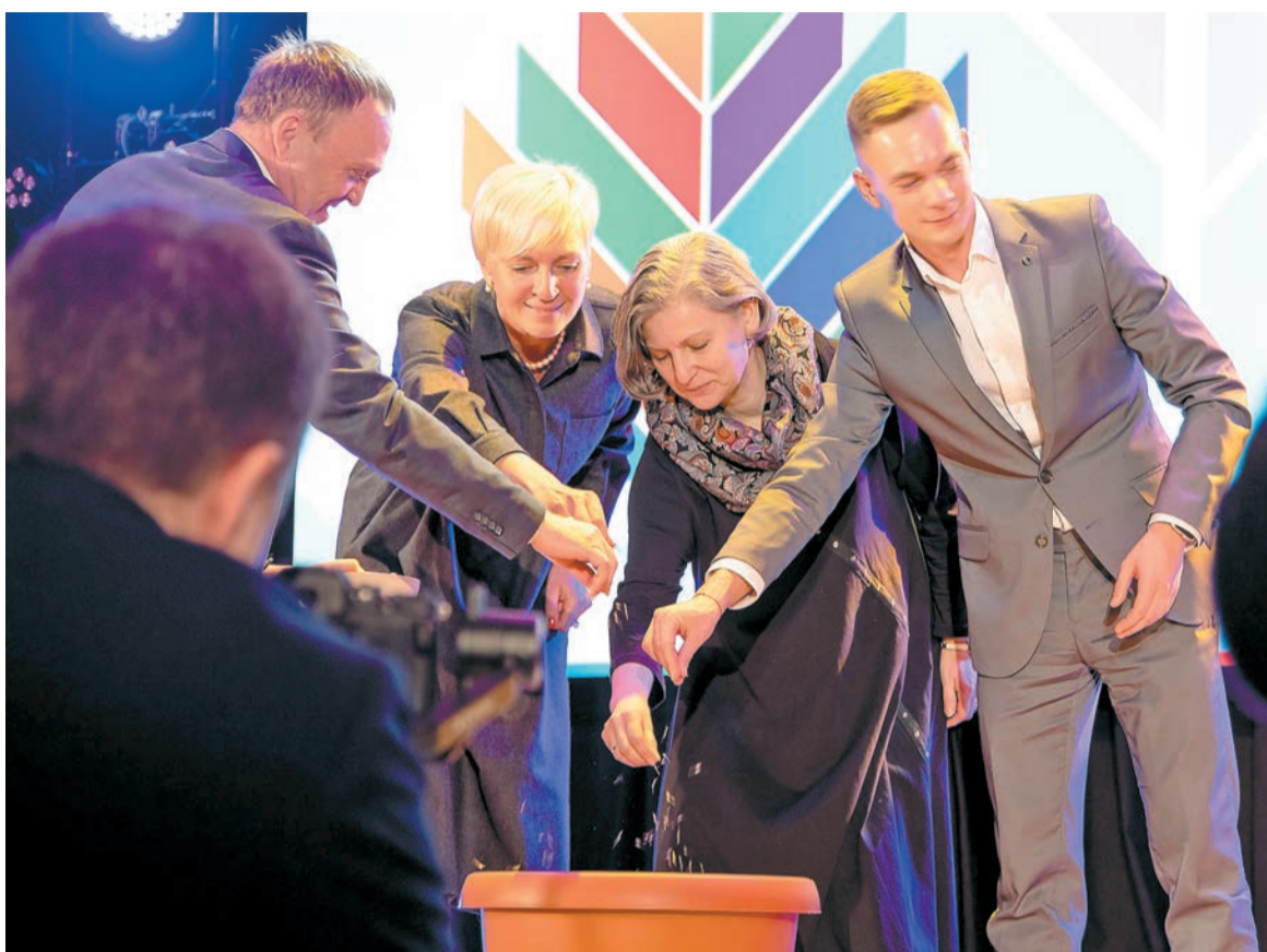
Фрагмент торжественной церемонии открытия проекта «Расцветай, город» в Краснокамске