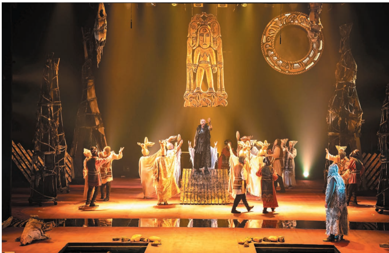
Спектакль «Зарни-инь. Золотая Баба» (Коми-Пермяцкий драматический театр)

— Фестиваль показал: национальный театр в России есть! Это главное. Он очень разный, и разные фестивали ему посвящены. Есть огромный фестиваль «Федерация», который проходит