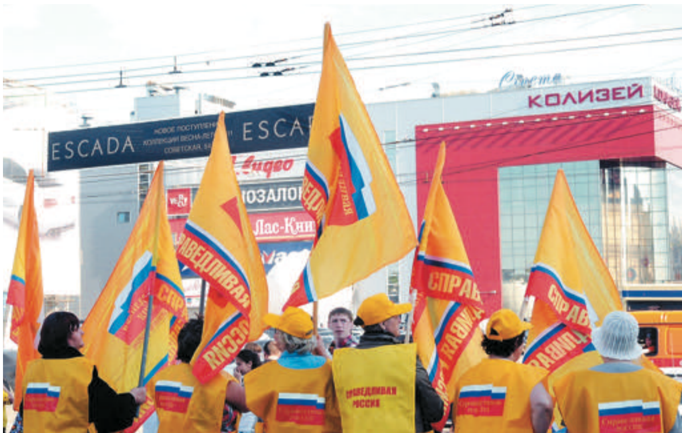
Под флаги эсеров на выборах переметнулись даже боссы «Единой России»