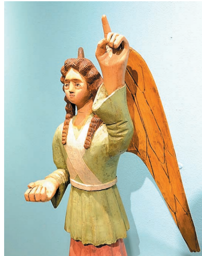
Копия деревянного ангела специально сделана для выставки «Неземная красота», чтобы дети могли к нему прикоснуться

Каких только коллекций здесь нет! Роботы-трансформеры, календарики, открытки, плюшевые медведи, бумажные деньги, изделия из макарон, фарфоровые зверушки, миниатюрная обувь... Да, несмотря на то что прелестная