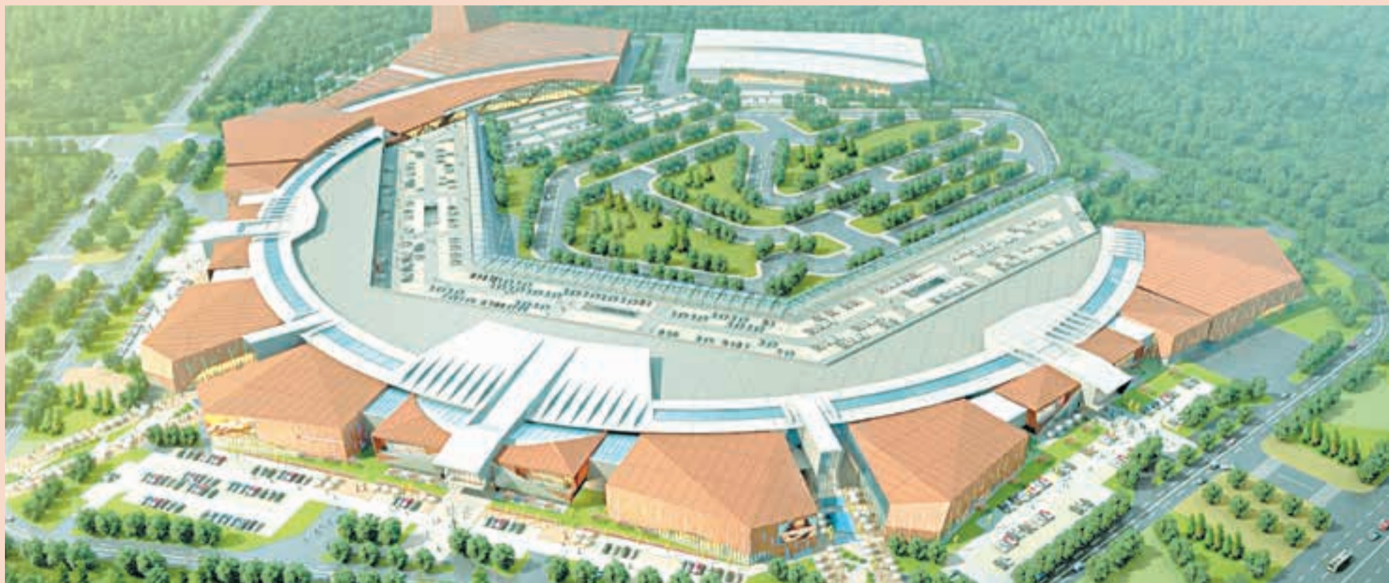
Перспективы строительства в Камской долине многофункционального комплекса теперь зависят от того, кто пожелает приобрести уже имеющийся проект вместе с земельным участком

Играет роль мультиформатность проекта. Учитывая масштабность заявляемых проектов и специфику строительства в рассматриваемом районе, интересны для привлечения как федеральные, так и международные игроки. Но для этого нужна воля краевой власти и практические шаги, способные сформировать интерес для инвесторов. ■