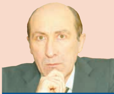
Эмиль Маркварт, президент Европейского клуба экспертов местного самоуправления

М ировая практика знает четыре основные модели организации управления муниципалитетом: