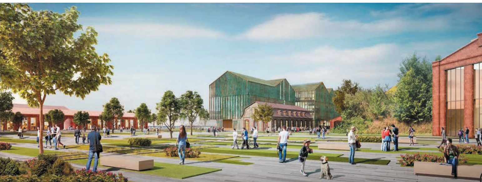
Здание галереи в пространстве «Завода Шпагина»

На втором этаже расположится 10 разделов. Начало экспозиции будет посвящено основанию художественного музея, которому в 2022 году исполнится 100 лет. В этой документально-фотографической экспозиции будет рассказываться о первых экспонатах, о том, как собира-