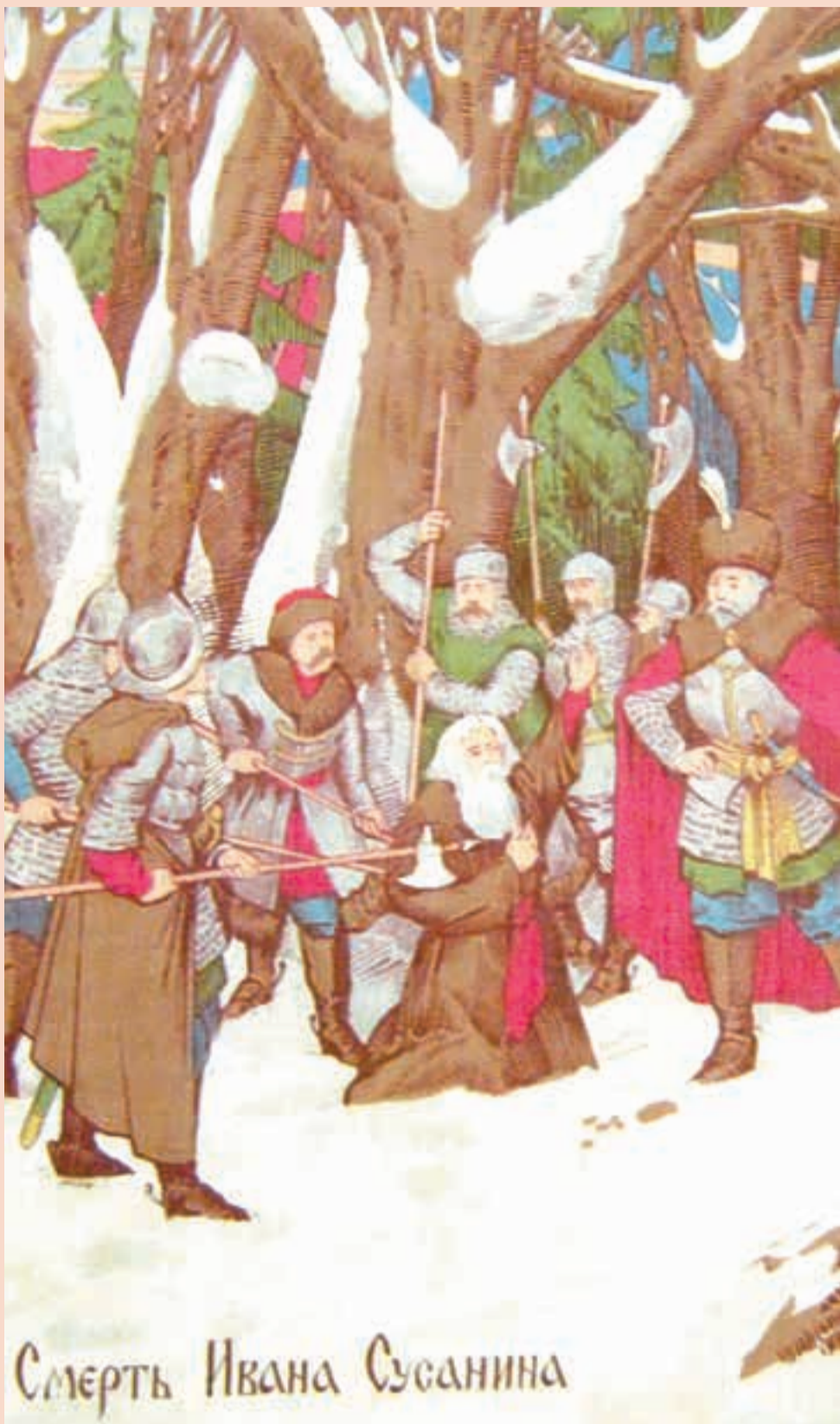
Уникальный экспонат из коллекции Пермского краеведческого музея. Фрагмент сувенирной ткани. Товарищество Прохоровской Трёхгорной мануфактуры в Москве, 1913 год. Выпущен к 300-летию дома Романовых