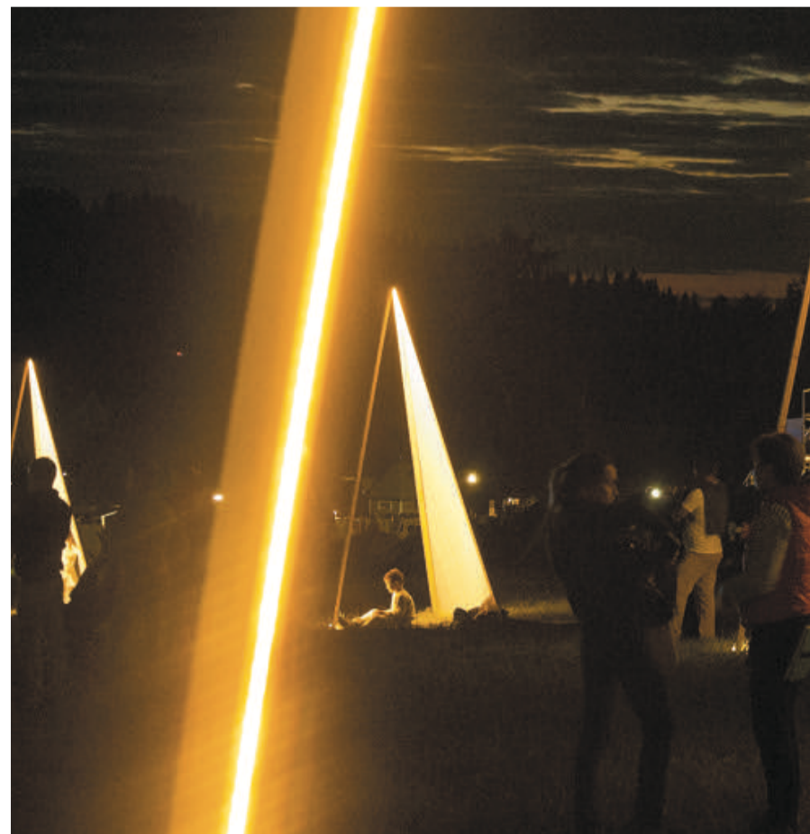
«Треугольники», паблик-арт объекты для фестиваля KAMWA в Хохловке.

Кредо: я не придумываю смыслы. Скорее, создаю условия, чтобы они проявлялись.