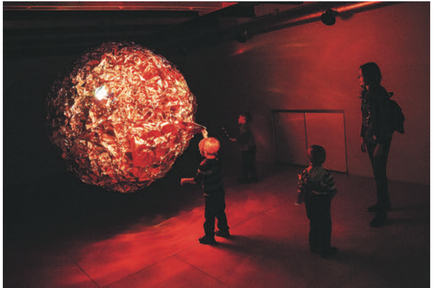
«Шар», световая инсталляция для однодневного благотворительного фестиваля «День Солнца»

— Свет не белый. Он в течение дня сильно меняет свою температуру, и это влияет на нашу физиологию. Ближе к вечеру свет теплеет, тело