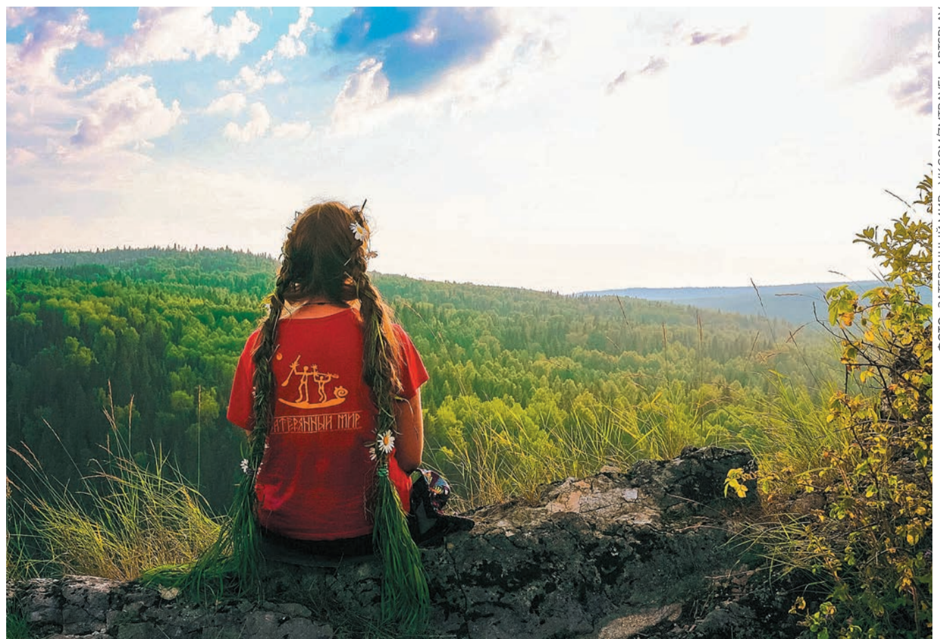
ФОТО «ЗАТЕРЯННЫЙ МИР», VK.COM/ZIMTRAVEL_ARTSPLAY

— На тематические сплавы люди собираются по интересам. Если вы увлекаетесь йогой, то можно поехать и позаниматься любимым хобби на сплаве. Если любите бардовские песни, можно взять с собой не только гитару, но и музыканта. При этом на таких сплавах туристы обычно не готовят, вместе с ними едет повар. Предоставляется, конечно, и оборудование, есть свой план экскурсий. Дополнительные опции могут быть самыми разнообразными — от свежеприготовленного кофе до мобильной баньки. КФ