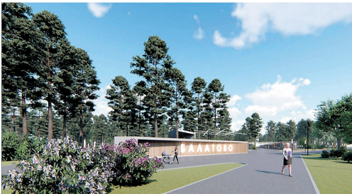
Слайд из презентации проекта

По замыслу разработчиков, парк будет состоять из главной аллеи, площади для проведения массовых мероприятий со сценой, трибунами и девятью павильонами различного назначения, скалодрома, спортивных и детских площадок, мест для спокойного отдыха, верёвочного парка,