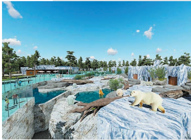
Слайд из презентации проекта нового зоопарка в Перми

Согласно обновлённому перечню объектов капстроительства, сроки строительства зоопарка в Перми сдвинуты на 2023 год. В обосновании указано, что это сделано в связи с необходимостью корректировки проектно-сметной документации по результатам обследования. Кроме того, перенесены на 2024 год сроки строительства новой сцены оперного театра: ранее проект планировалось реализовать не позже 2023 года. «В связи с затянувшейся разработкой проектно-сметной документации по причине длительной процедуры передачи земельных участков, расположенных в границах проектирования, в собственность края», — сказано в пояснительной записке к проекту постановления.