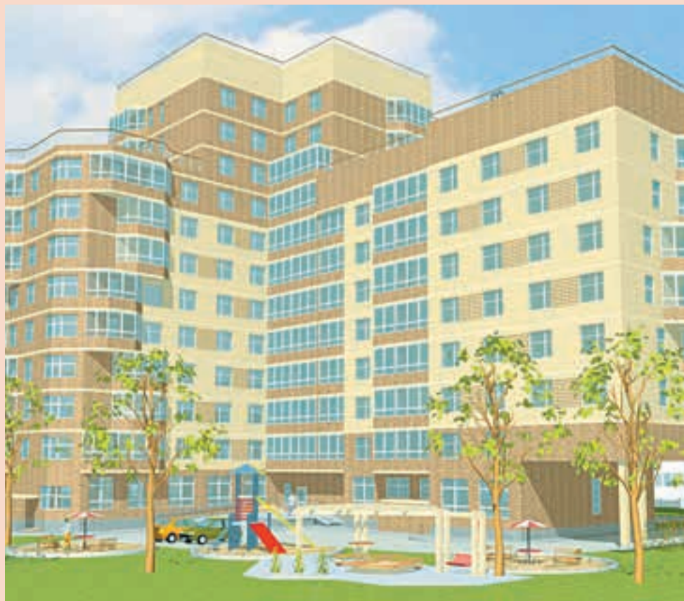
Покупатель сегодня оценивает не «квартирные метры», а предложение «в комплекте»