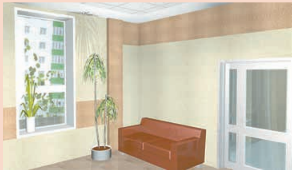
Строители стремятся предоставить покупателям «готовый продукт»

Всё дальше идут компании в создании внутреннего интерьера квартиры.