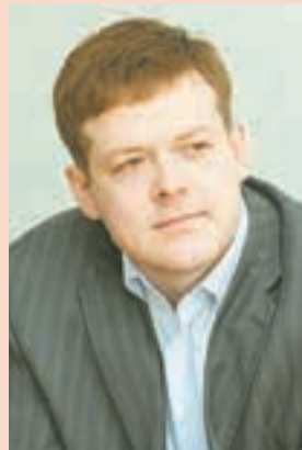
Иван Огородов, и. о. министра сельского хозяйства и продовольствия Пермского края:

Заявив, что «суд не должен вникать в суть сделок, на основании которых когда-то, в 2008 году, эти векселя появились», истец назвал попытки