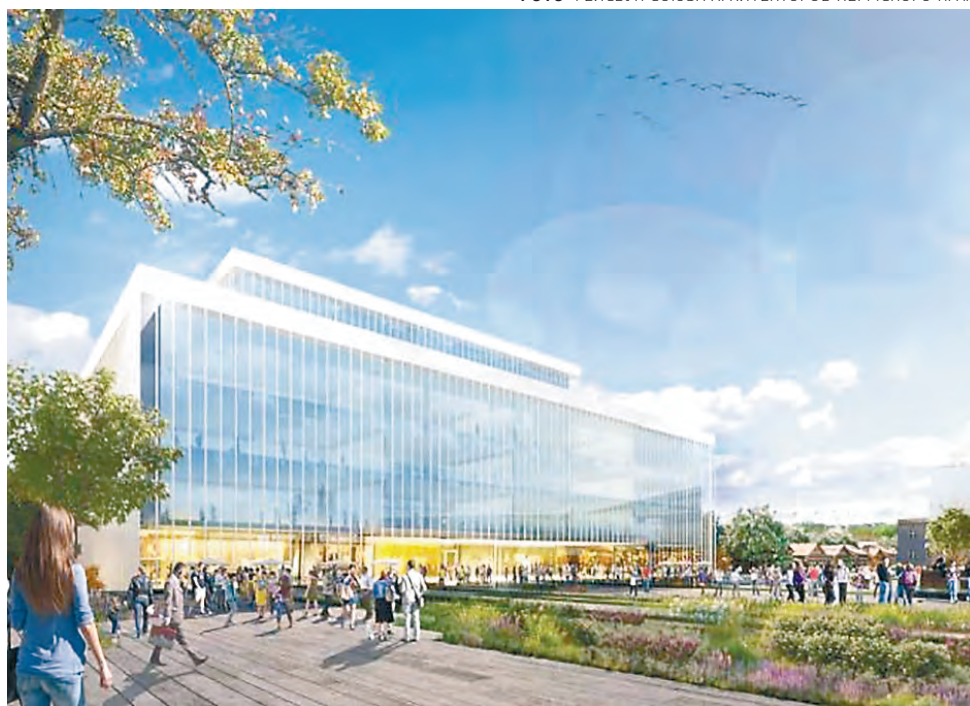
Возможно, так будет выглядеть фасад нового здания театра