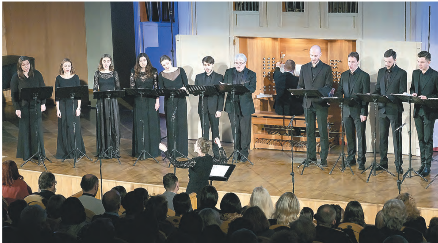
Вокальный ансамбль Intrada

Истинное откровение случилось во втором отделении, где прозвучали партесные полифонические концерты русского композитора XVII–XVIII веков Василия Поликарповича Титова. Полифония Титова — это настоящая филигрань, сплетение тонких серебряных ниточек, звуковое выражение нарядного стиля русского барокко. В ансамбле 14 певцов, а хоры Титова написаны на 12 голосов. Представьте только: практически сколько певцов — столько и партий! Каждый при этом безупречно выводил свою линию, и в должный момент это сложнейшее многоголосие сливалось, как по волшебству, в чистейший унисон. Впечатление, которое в этот момент испытывали зрители, было настолько сильным, что не только занимало слух и мысли, но и расплзалось по всему телу, вторгаясь в область физиологии.