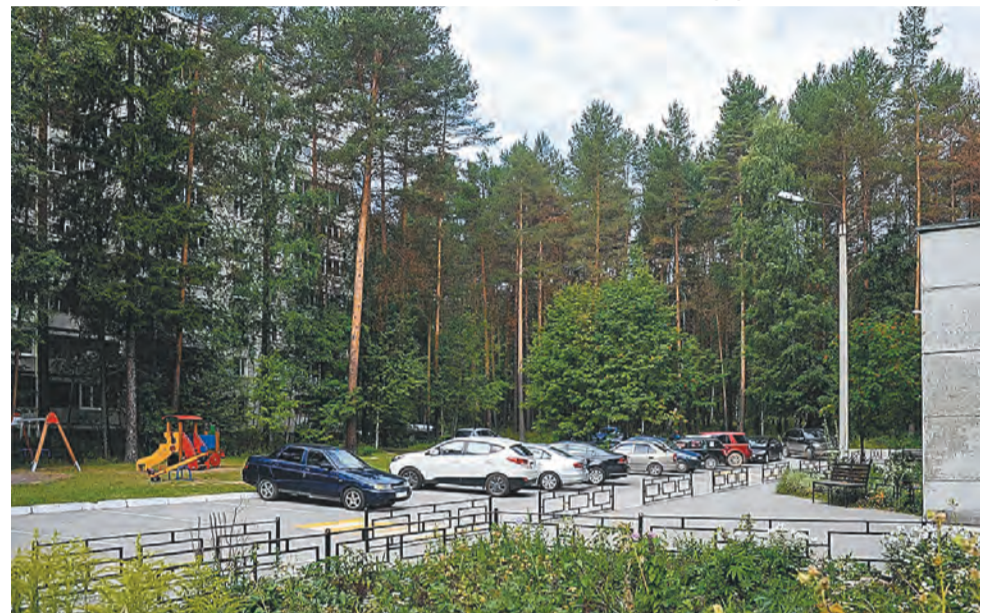
ФОТО ВКОНТАКТЕ «ПЕРМЬ ПЕРВАЯ»

С учётом того, что в Перми на работы по благоустройству и так закладываются большие средства, дополнительное финансирование из краевого бюджета позволит городу благоустроить ещё боль-