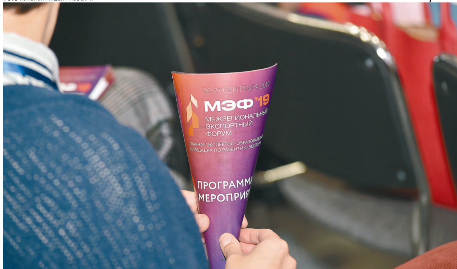
В форуме приняли участие 3 тыс. человек из 16 стран мира