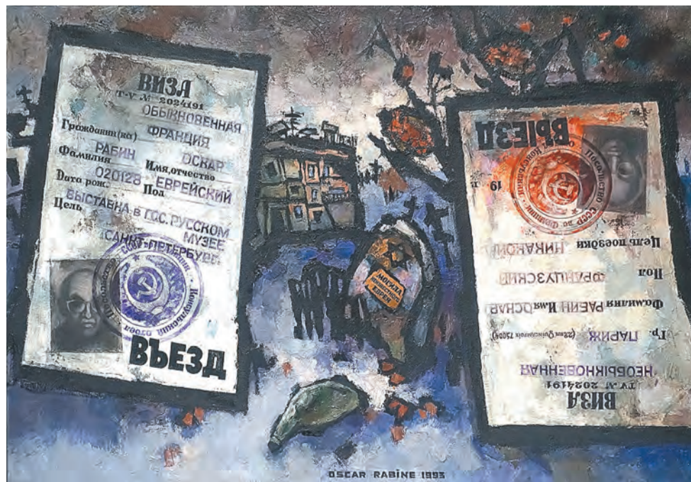
Оскар Рабин. «Виза», 1993 год

История этой семьи драматична. Здесь были и гонения, и лишения, и безвременные кончины. Самый знаменитый и самый драматичный момент — это «Бульдозерная выставка» 15 сентября 1974 года (выставка в «Уникуме» посвящена печальному юбилею — 45-летию этого события), где Оскар Рабин не только выставил свои