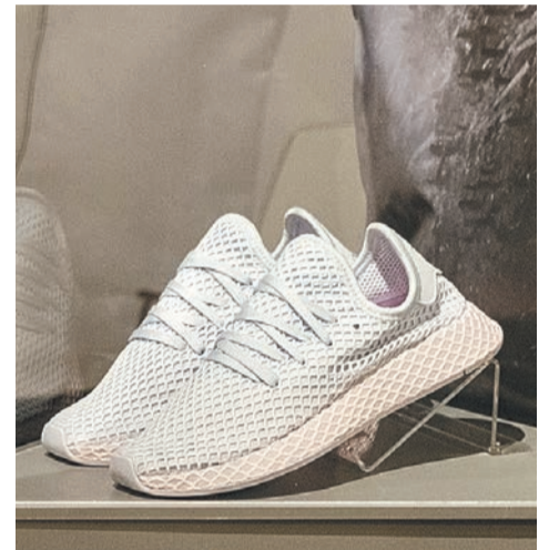
Модные кроссовки из 100%-ного пластика от Parley, Adidas и Стеллы Маккартни