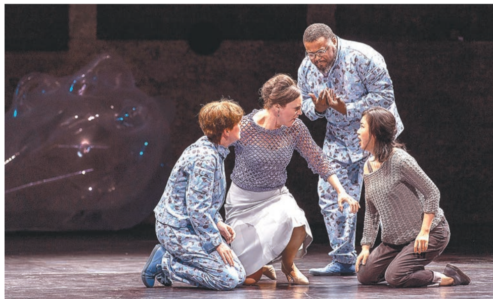
Квартет в начале второго отделения «Идомедея» похож на па-де-кватр

Публика приняла премьеру тепло, но далеко не так, как накануне принимала Шостаковича. Это были совершенно разные оттенки тепла.