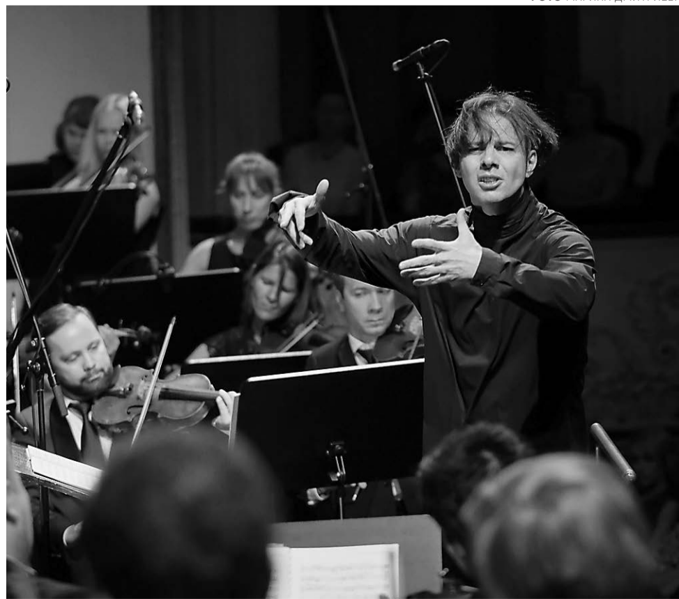
Теодор Курентзис дирижирует в Пермском театре оперы и балета