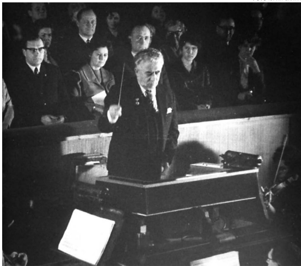
Арам Хачатурян за дирижёрским пультом Пермского театра оперы и балета