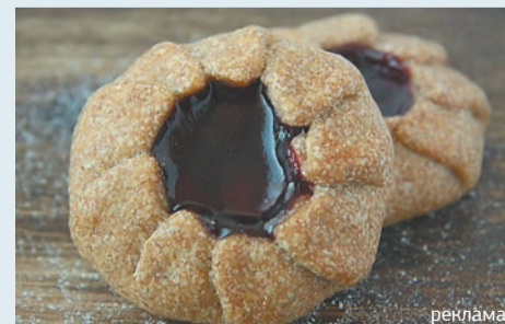
Галета постная с вишней. Тесто из пшеничной цельнозерновой муки, вишнёвый конфитюр