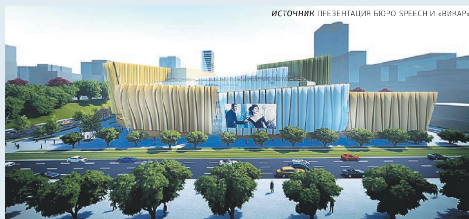
ИСТОЧНИК ПРЕЗЕНТАЦИЯ БЮРО SPEECH И «ВИКАР»

Итогом обсуждения стало направление вопроса на публичные слушания. Они состоялись 13 мая, 24 мая комиссия утвердила их итоги, а на пленарном заседании гордумы 28 мая депутаты должны окончательно решить этот вопрос.