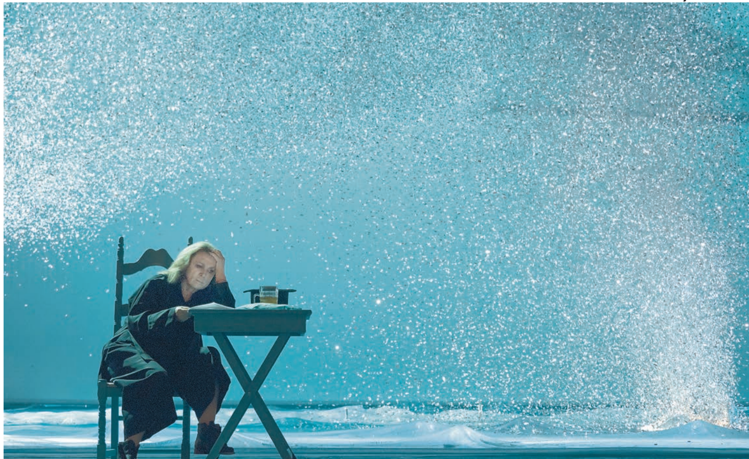
Спектакль Анатолия Васильева «Старик и море» стал кульминационным событием Дягилевского фестиваля