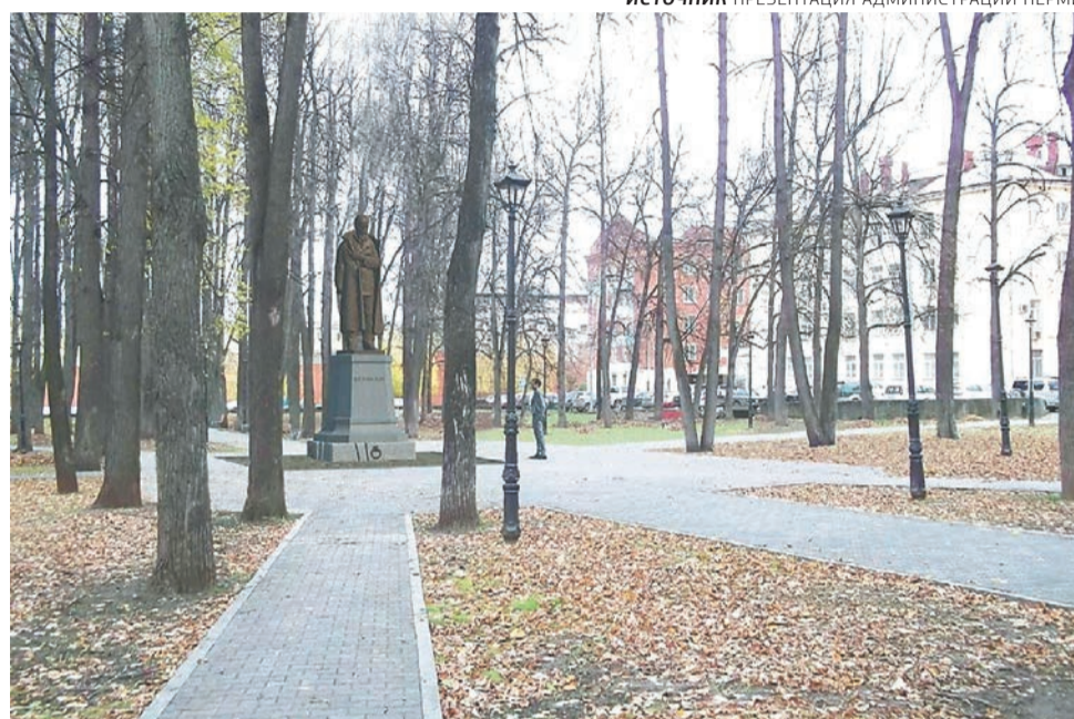
Эскиз памятника Достоевскому, который появится в саду Декабристов

Кроме того, совет одобрил название пока также не существующей улицы Бориса Коноплёва в застраиваемом микрорайоне Красные Казармы (между