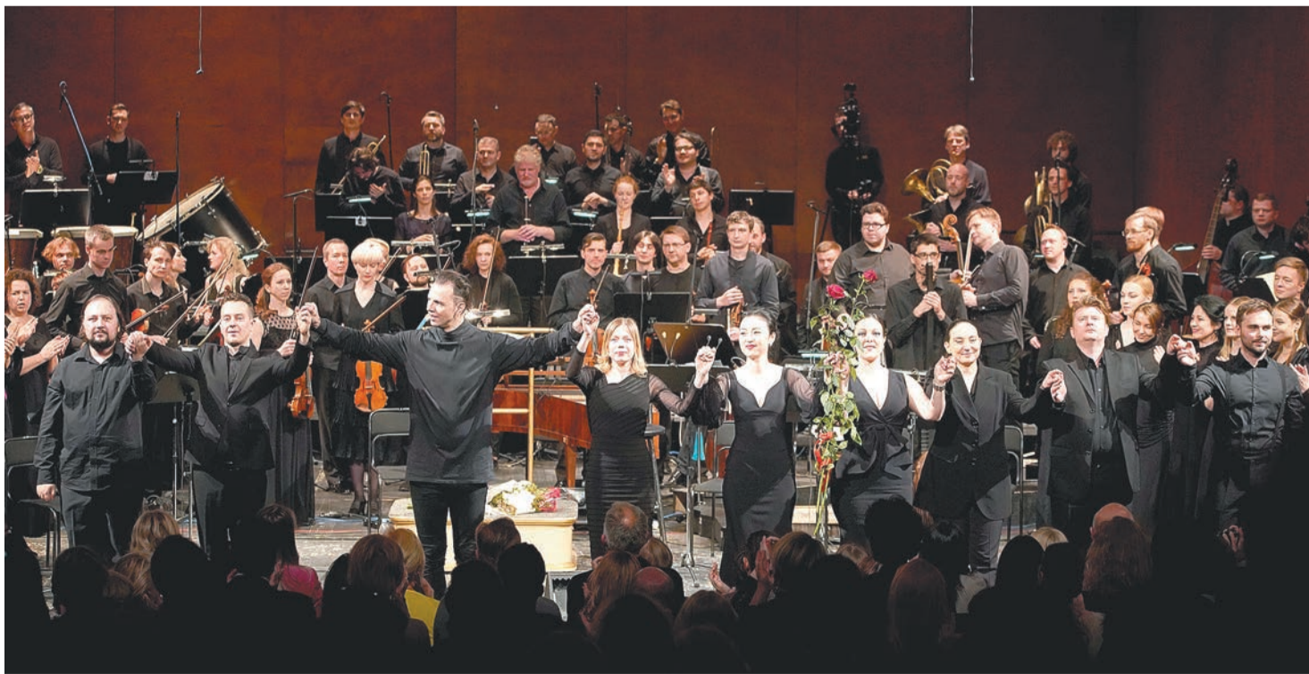
Теодор Курентзис — центр не только концертного исполнения оперы «Идоменей» (на фото), но и всего фестиваля