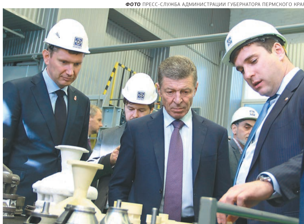
Максим Решетников и Дмитрий Козак в АО «Новомет-Пермь»

В АО «Сибур-Химпром» Дмитрий Козак открыл новое производство пластификатора общего назначения — диоктилтерефталата (ДОТФ). По сво-