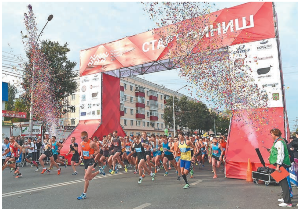
В этом году Пермский международный марафон пройдёт 7 и 8 сентября. Регистрация уже открыта