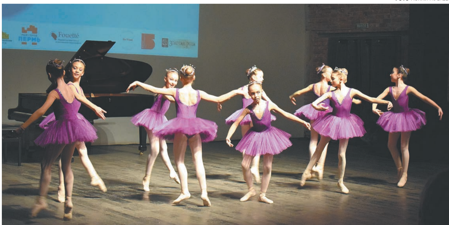
Частная школа хореографии «Фуэте»

Концерт открылся выступлением девочек из частной школы хореографии «Фуэте», которые исполнили специаль-