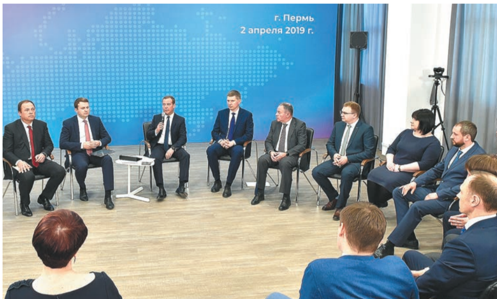
Часть совещания с представителями бизнеса была закрытой для прессы