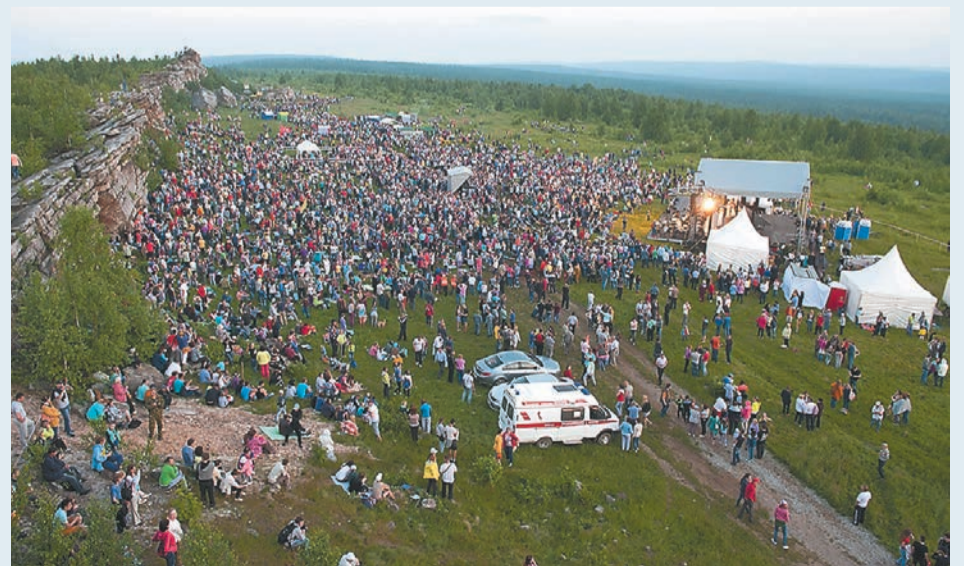
Ежегодно «Тайны горы Крестовой» собирают тысячи поклонников искусства