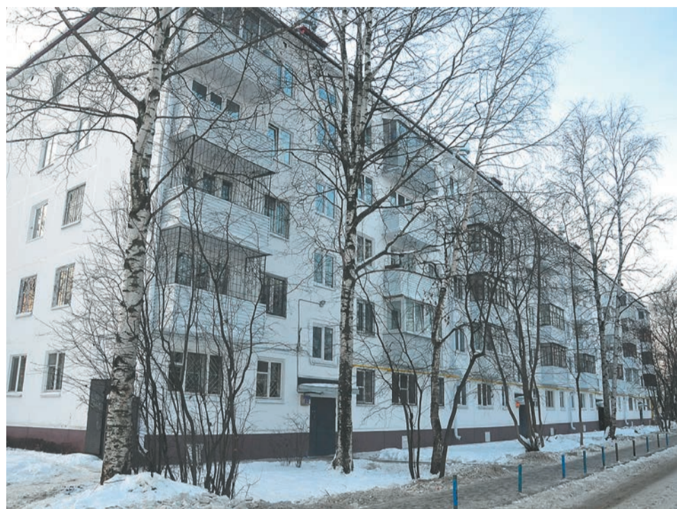
Перми не хватает хороших квартир в старом фонде