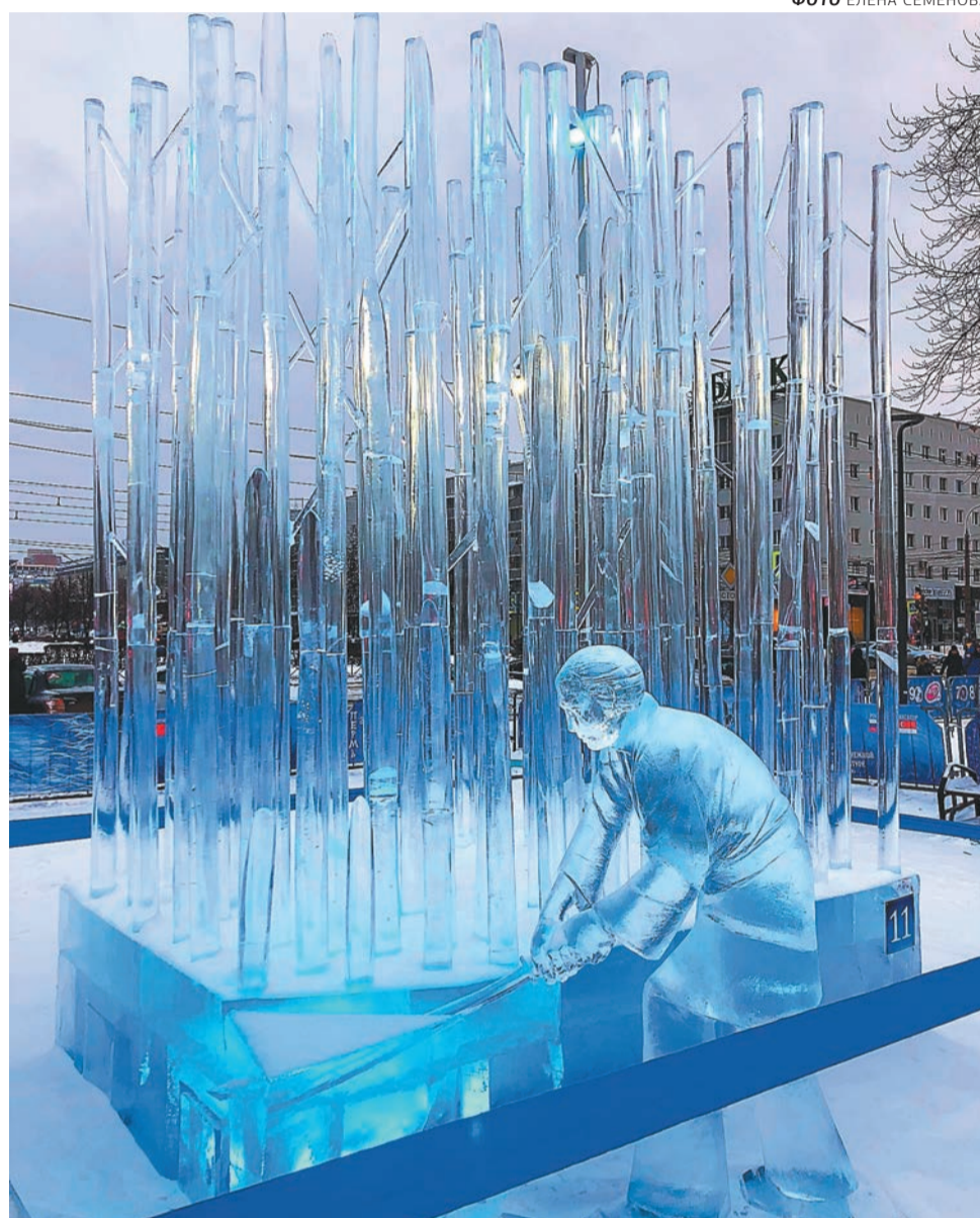
«Один взмах меча»

из Сингапура — переплетение журавликов, где выточено каждое пёрышко, или «Фукуроу. Несущая удачу» — столь же мастерски выполненная сова.