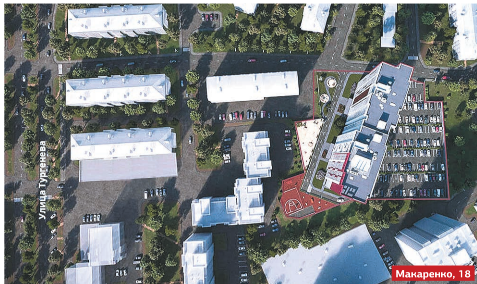
Вид сверху на будущий жилой комплекс.

Собственники дома на ул. Макаренко, 18 также написали обращение на имя главы Мотовилихинского района Александра Хаткевича, в котором среди прочего указано, что строительные работы привели к растрескиванию межпанельных швов жилого дома. Кроме того, обращения с просьбой провести проверку законности установления границ участка под новый дом были направлены на имя главы города Дмитрия Самойлова и в адрес главы департамента градостроительства и архитектуры (ДГиА) Перми Марии Норовой. В градостроительном департаменте ответили, что объект возводится в соответствии с действующими