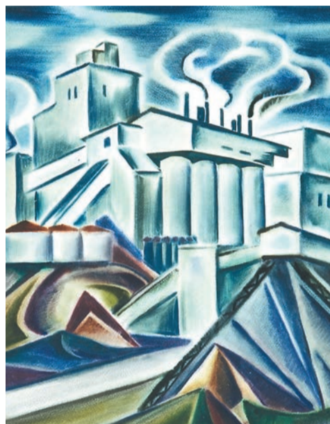
«У Содового завода», 1976 год

Даже в промышленных пейзажах бросается в глаза изысканность светотени, туманный налёт, превращающий прозаичные индустриальные объекты в волшебные крепости. Этот индустриальный романтизм сближает Борисова