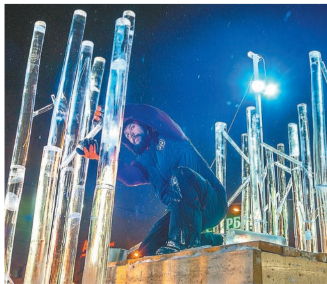
Так создаются ледяные скульптуры