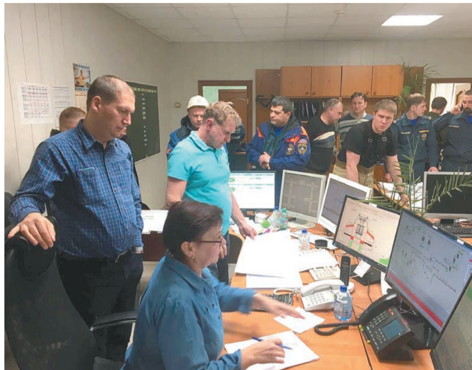
На месте событий был организован оперативный штаб

Каждая семья получит по 1 млн руб. от Пермского края (вне зависимости от прописки), по 3 млн руб. от ПАО «Уралкалий», по 2 млн руб. от ФГУП «УС-30 СМУ-680». «Конечно, это не смягчит горечь утраты, но поможет выстоять