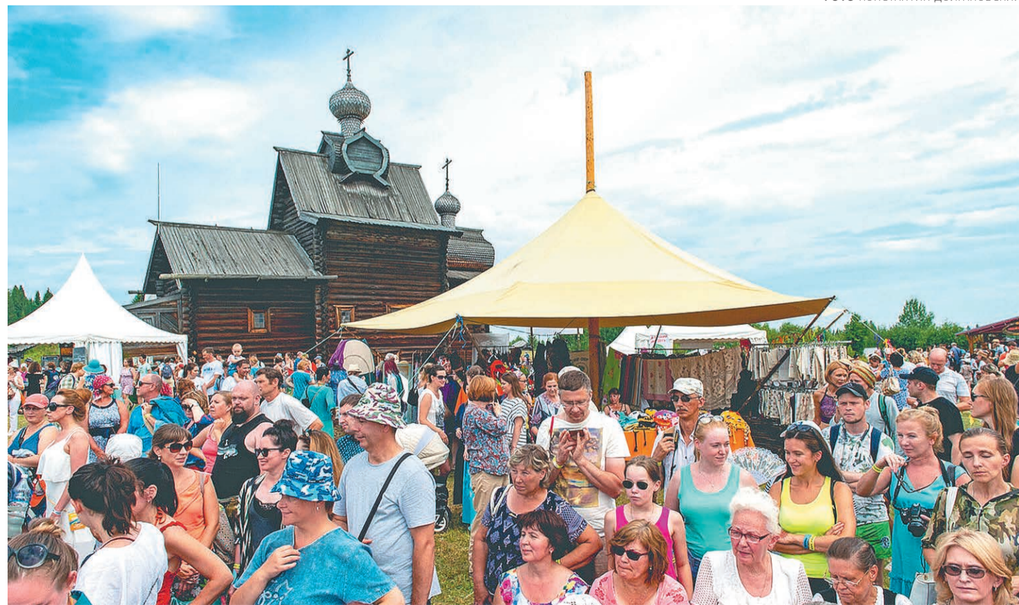
Фестиваль «Камва» в 2018 году прошёл в последний раз