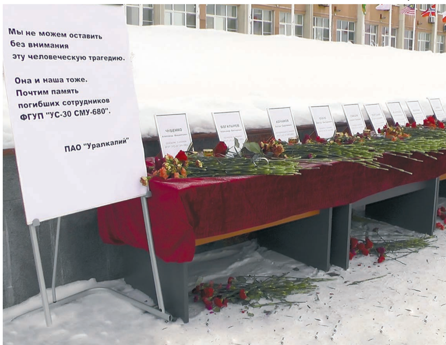
В момент задымления в шахте находились 17 человек, выжили только восемь