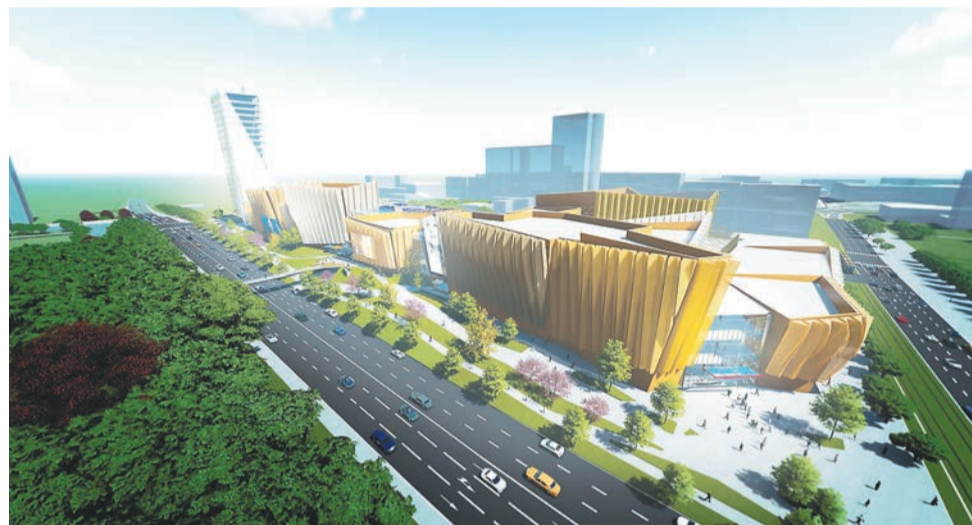
Многофункциональный центр на месте бывшей кондитерской фабрики будет выглядеть так

Пермская компания «Упакс-Юнити» — производитель одноразовой пищевой упаковки — реализует проект глубокой переработки полиэтилен-терефталата (ПЭТ-пластика) и произ-