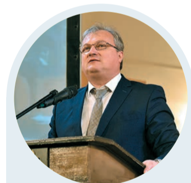
Николай Уханов, министр транспорта Пермского края:

Кстати, по итогам соцопроса среди положительных изменений в крае жители прежде всего отметили ремонт и строительство дорог (63,7% опрошенных). Два трети респондентов заявили, что за последний год состояние дорог в крае улучшилось (64,7%). В рейтинге социальных проблем региона, который формируется по итогам опроса, проблема качества дорог опустилась на седьмое место, хотя до этого стабильно входила в первую пятёрку. Половина населения довольна состоянием дорог в своём муниципалитете. Губернатор Пермского края Максим Решетников в ходе бюджетного послания отметил: «Это гово-