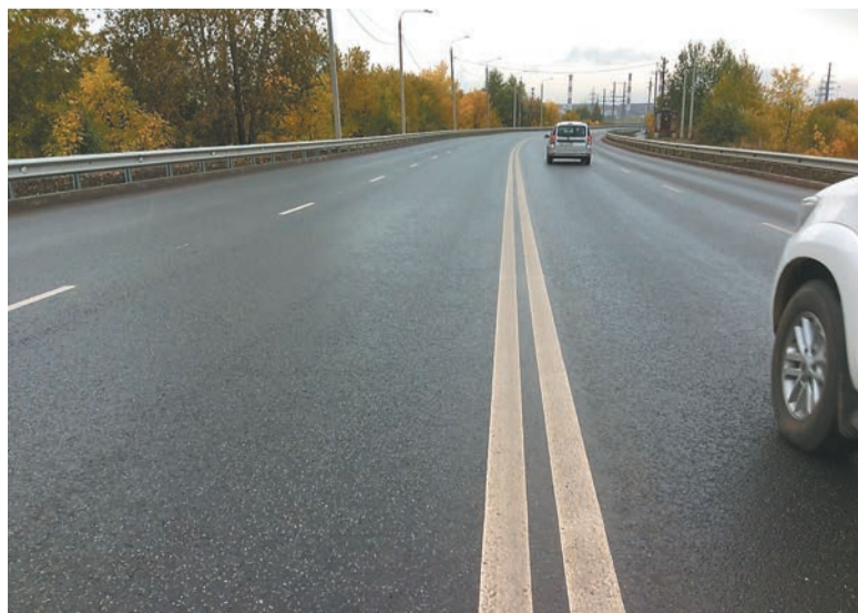
г. Пермь, ул. Леонова

По информации регионального минтранса, на 2019 год от муниципальных образований поступили предложения по 261 объекту общей протяжённостью более 370 км на сумму 3,2 млрд руб., на 2020 год — по 213 объектам общей протяжённостью более 365 км на сумму 3,7 млрд руб.