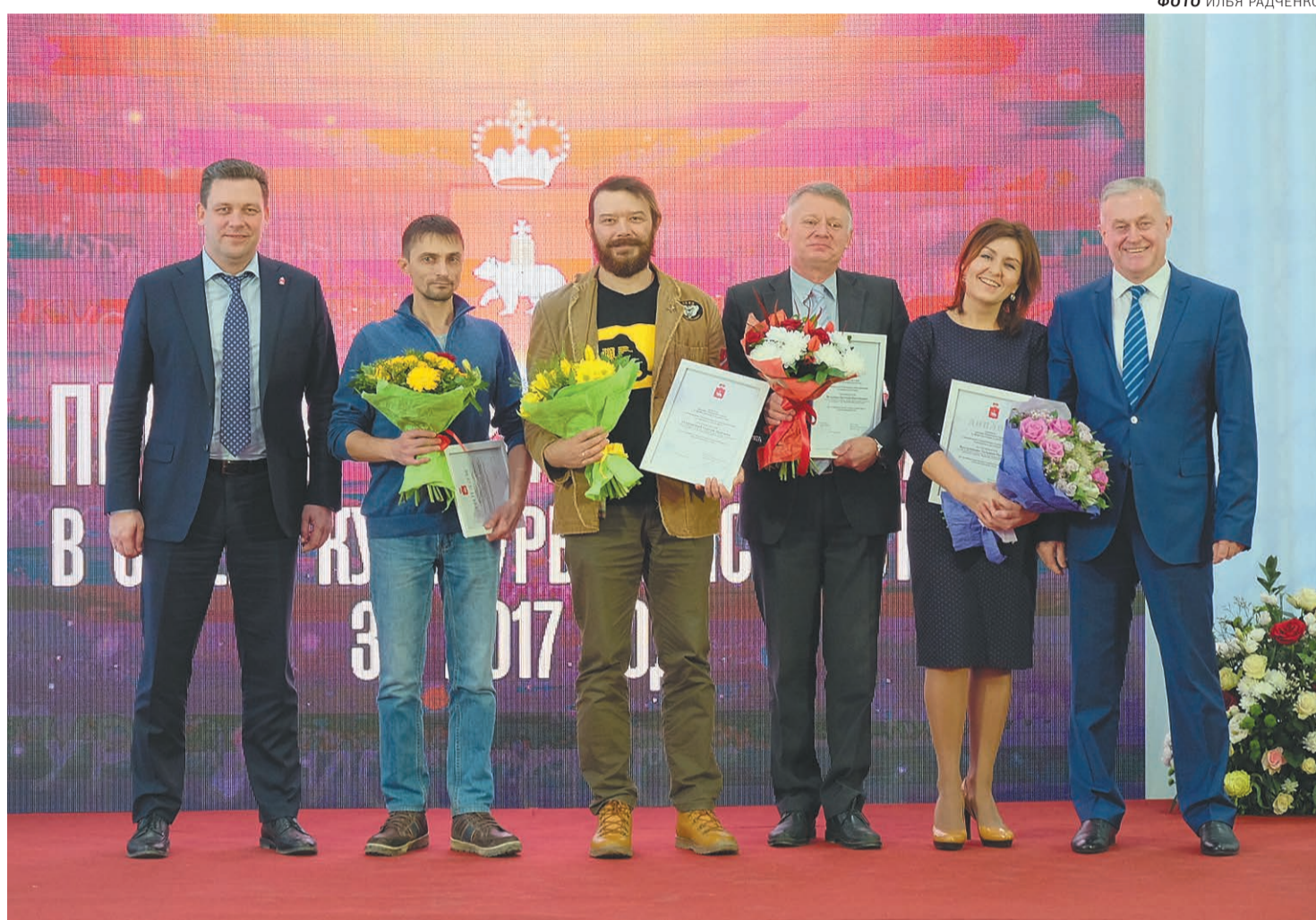
Награды и поздравления принимает коллектив Пермского краеведческого музея

Ещё один лауреат в этой номинации — научно-исследовательский