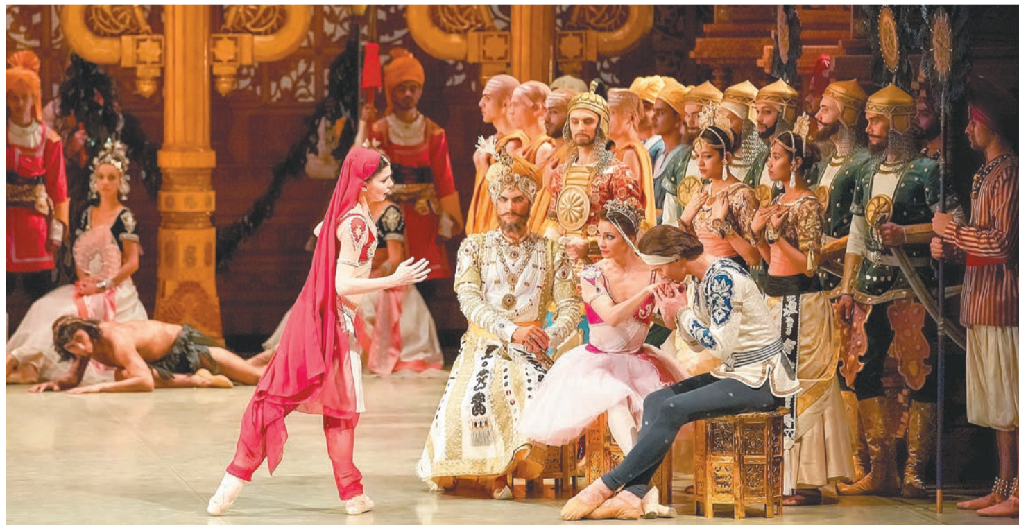
Пермский театр оперы и балета в честь открытия Года театра пригласил коллег со всего Пермского края на открытую репетицию балета «Баядерка»

Нам предстоит очень увлекательный год, хотя, по правде говоря, в Перми каждый год — год театра, потому что Пермь — театральный город.