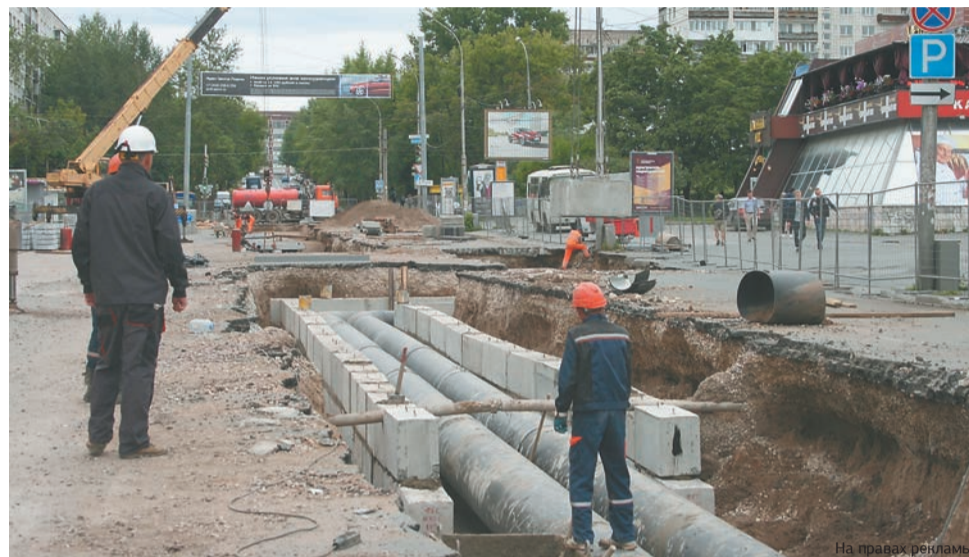
Летом энергетики переложили 28 км тепломагистралей в Перми

Мартьянов рассказал, что в 2018 году компания реализовала крупные проекты по ремонту 27 объектов генерации (17 крупных агрегатов, пять паровых турбин, две газовые турбины). Помимо этого, были отремонтированы пять гидроагрегатов Широковской ГЭС. Сумма инвестиций составила 700 млн руб. Дополнительно свыше 800 млн руб. было направлено на ремонт и реконструкцию тепловых сетей. Общий объём инвестиционной программы филиала составил 1,6 млрд руб. В 2019 году