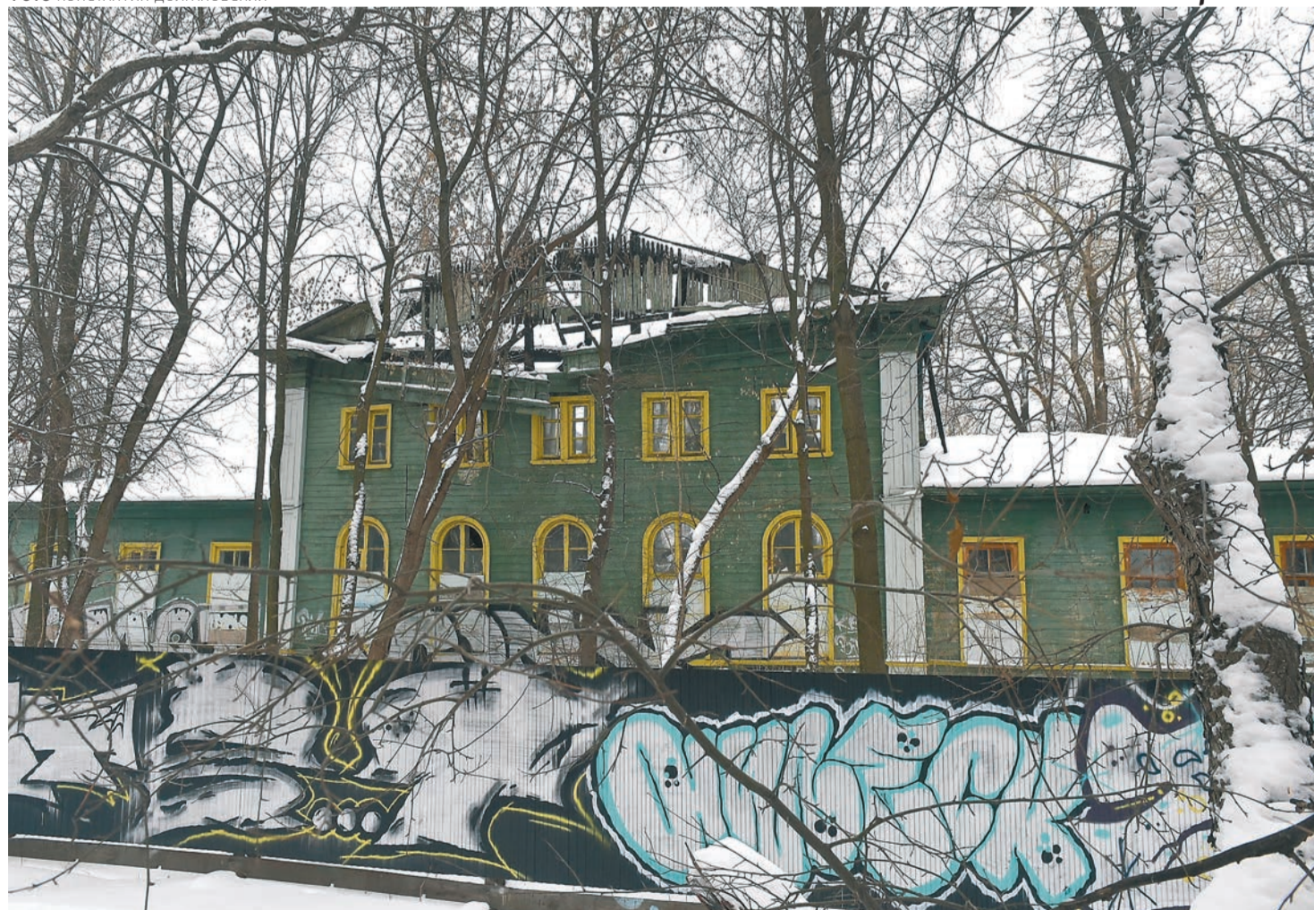
Специалисты считают, что повреждённое пожаром здание на ул. Сибирской, 26а можно и нужно восстанавливать

Армен Гарслян: Такой поддержки мы ещё не видели