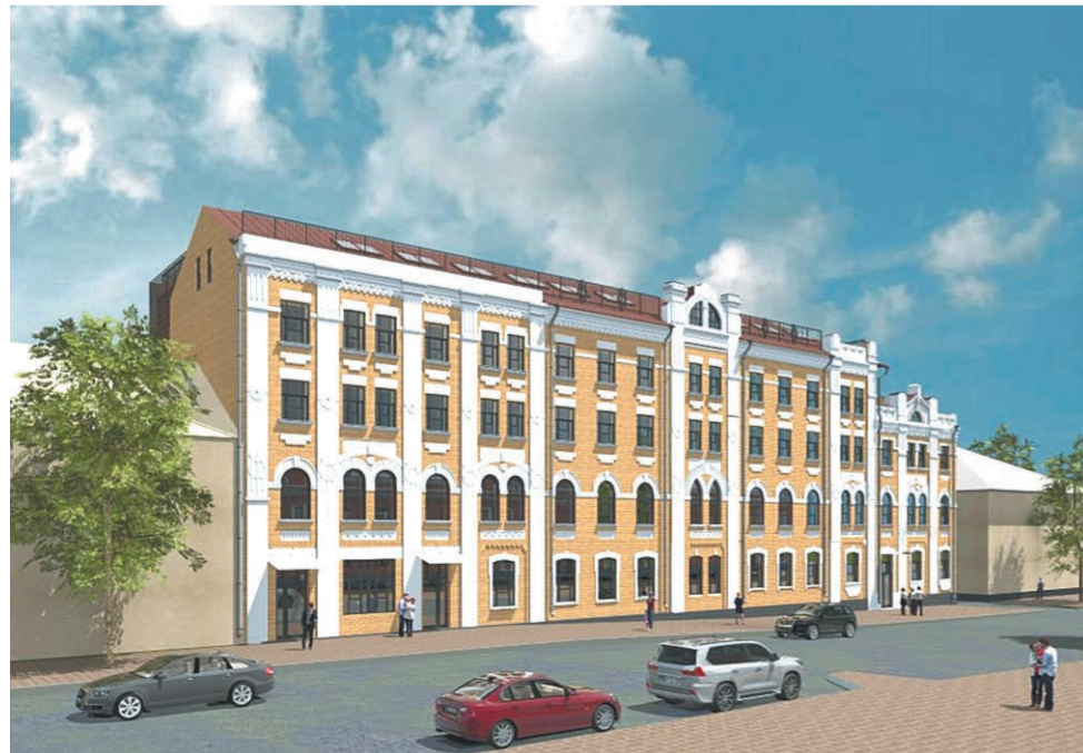
...а так он будет выглядеть после реставрации