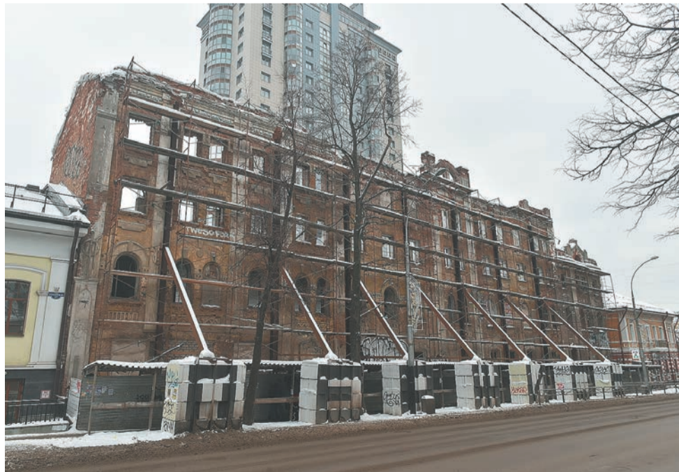
Так выглядит сегодня пивзавод Ижевского товарищества на ул. Сибирской...

Хорошая новость заключается в том, что, возможно, средства для реставрации найдутся в федеральном бюджете. Министерство культуры РФ объявило, что принимает заявки на конкурс на реставрацию объектов наследия, находящихся в федеральной собственности, и региональных объектов федерального значения. Госинспекция по охране объектов культурного наследия Пермского края направила на конкурс две заявки: на реставрацию здания иняза ПГГПУ (объект в федеральной собственности) и церкви в селе Пянтег Чердынского района (региональный объект федерального значения). Пянтежская деревянная церковь — старейшее зда-