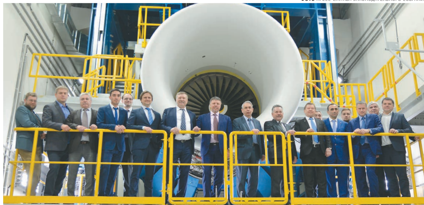
Депутаты Законодательного собрания на выездном заседании. За спиной — испытательный стенд АО «ОДК-Авиадвигатель»