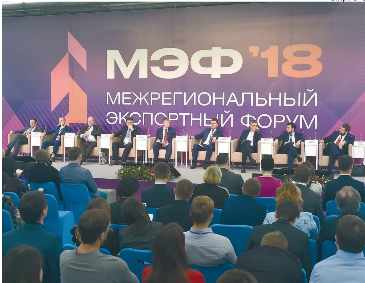
За два дня мероприятия форума посетили порядка 3 тыс. участников и экспертов