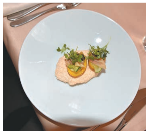
La Bottega. Картофель Романовф

ливы на основе квасного сула должен подчеркнуть вкус утраты.