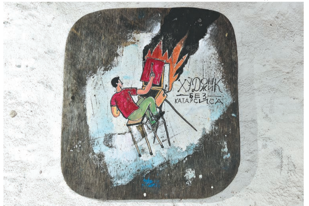
... и его творчество