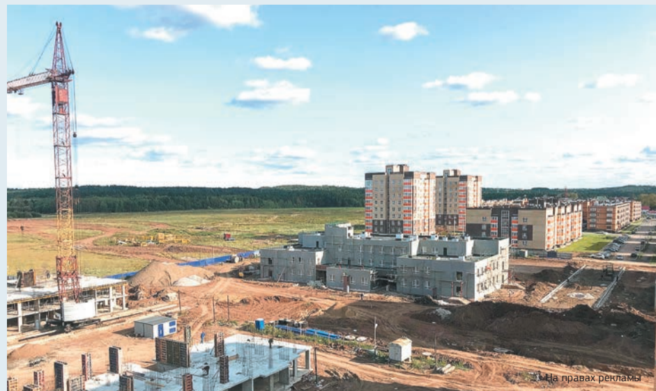
Иллюстрация: права рекламы

Обеспечение обязательств застройщика предусмотрено договором №129 от 17.03.2008. Заключая этот договор, застройщик согласился с указанным условием. Предметом судебного разбирательства в основном было требование администрации Перми о взыскании с застройщика неустойки в размере 17 млн руб., в удовлетворении которого судом было правомерно отказано. Необходимость установления обеспечения обязательств застройщиком не оспаривалась.