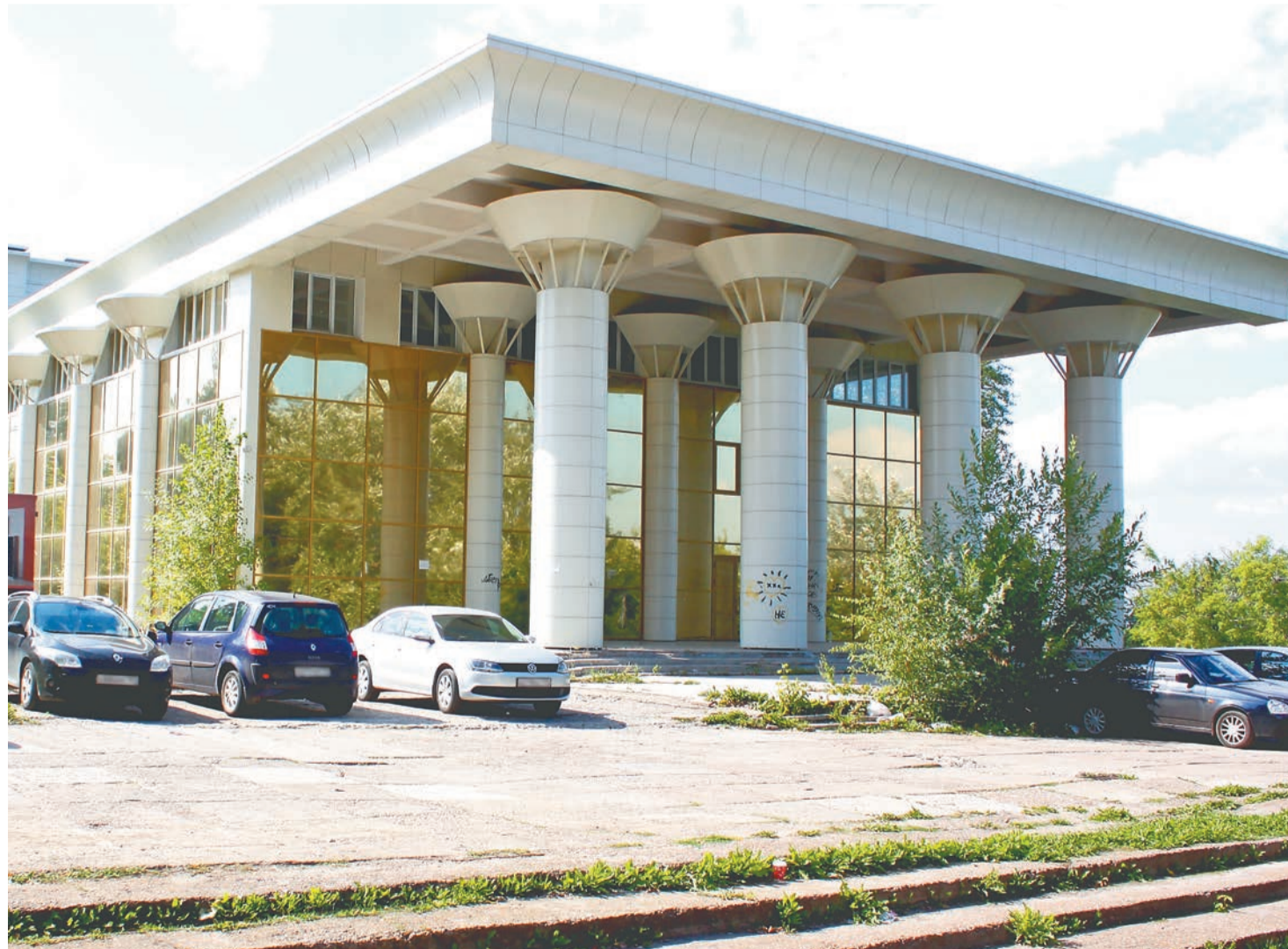
О том, что Дворец культуры «телефонки» находится в аварийном состоянии, говорится уже более 10 лет