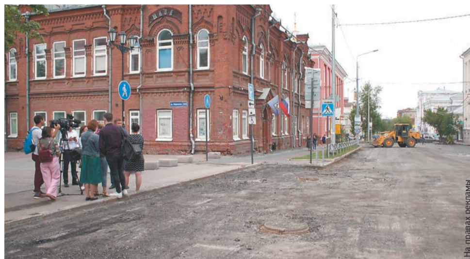
Перекладка теплосетей на ул. Газеты «Звезда» завершена, на очереди — магистраль на ул. Островского в районе перекрёстка с ул. Революции

Важно отметить, что старая труба в минеральной изоляции меняется на предизолированную в пенополиуретановой (ППУ) изоляции. Эти трубы очень устойчивы к коррозии. Срок их эксплуатации — 25 лет. По федеральной про-