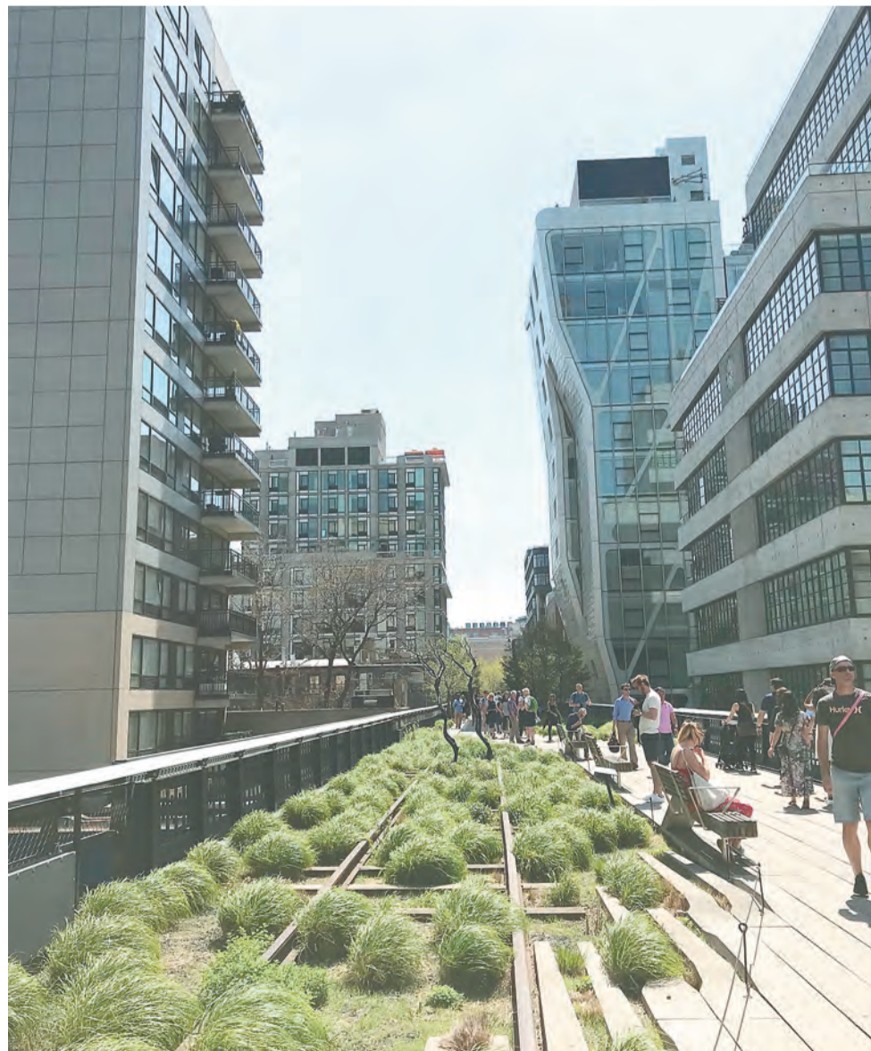
Хай-Лайн-парк в Нью-Йорке появился по инициативе жителей и органично вписался в городскую среду

Совсем всё разрушать далеко не обязательно. Сохранять аутентичность и значимые для горожан места — это очень важно.