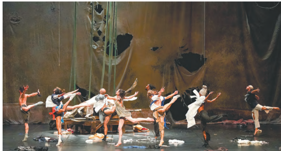
Сцена из хореографического спектакля «Не спать!»

То, что в Перми происходит нечто неповседневное, могли понять даже люди, далёкие от искусства: то тут, то там между зданиями, над тротуарами и площадями протянулись пластиковые стру-