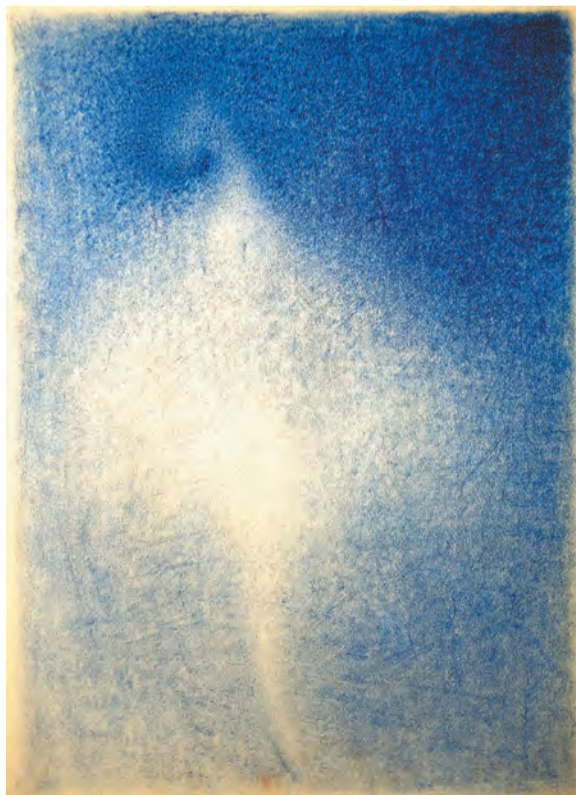
Василий Ситников «Танец». 1980-е годы