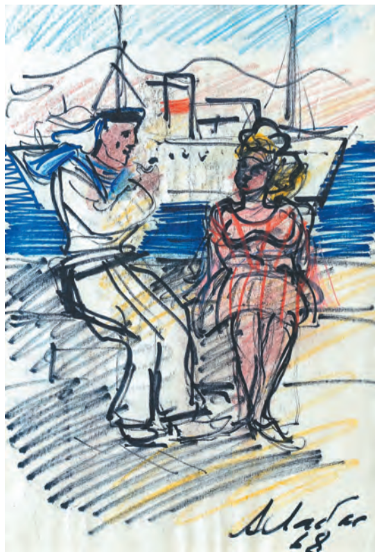
Александр Лабас «На пристани». 1968 год