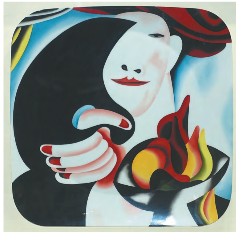
Олег Целков «Портрет с палитрой». 2009 год