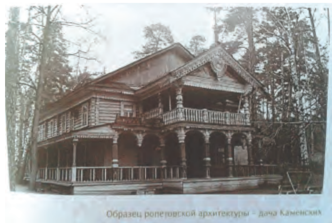
Образец ропетовской архитектуры — дача Каменских

зиной истории Закамска. А сохранение объектов культурного наследия, находящихся в муниципальной собственности, — прямая обязанность мэрии. Реставрация этих памятников архитектуры с частичным благоустройством береговой зоны могла бы стать хорошим подарком жителям Кировского района к 300-летию Перми. Кроме прочего, это послужит доказательством, что наш город пережил времена, когда инструментом реновации мог стать банальный поджог.