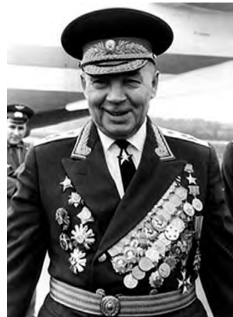
Генерал армии Василий Маргелов

«Памятный знак» предлагается сделать в виде гигантского комсомольского значка — 6,5 м высотой, на двух сторонах которого воспроизвести все ордена, которых был удостоен коммунистический союз молодёжи. «Это никакой не памятный знак, — со знанием дела