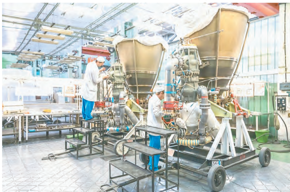
Ракетостроители примут участие в создании техники для добычи газа