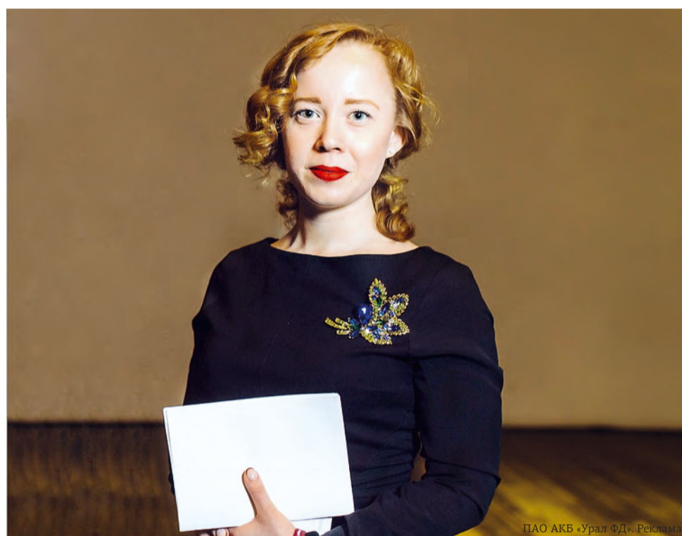
ПАО АКБ «Урал ФД». Реклама

— Основная задача банков — помогать населению сберегать свои накопления, и, наверное, именно поэтому банк для многих граждан является первым, а зачастую вообще единственным финансовым институтом, с которым гражданин