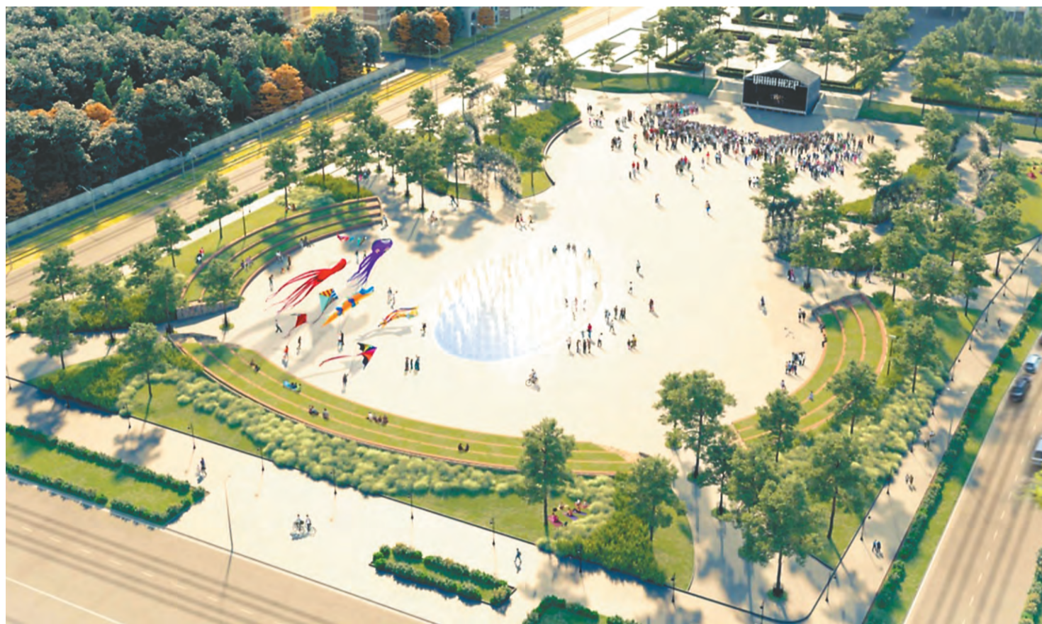
Проект компании «СБ Девелопмент»

В холмы предполагается встроить полукруглые многоуровневые скамьи для отдыха, которые одновременно будут и зрительскими местами амфитеатра. Такое решение позволяет максимально использовать площадь: зимой — для устройства ледового городка и новогодних гуляний, летом — для проведения фестивалей и концертов.