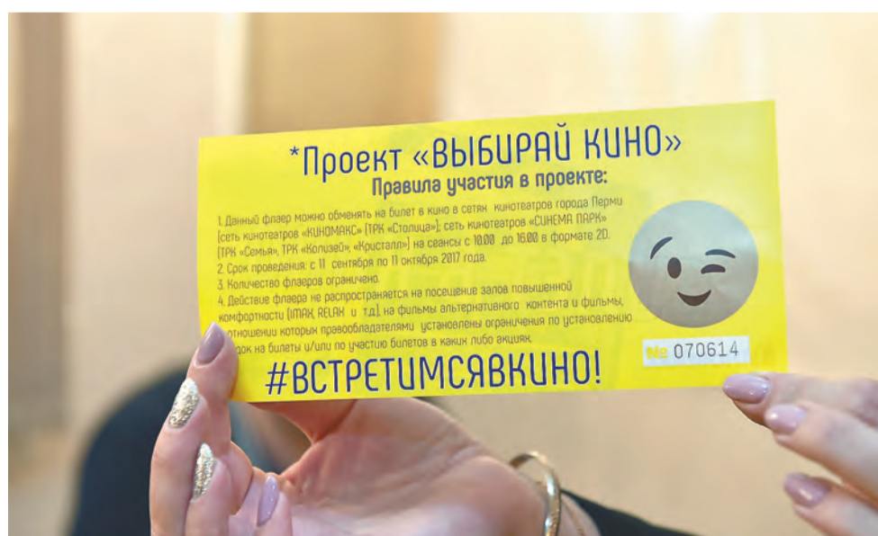
Из-за выдачи флаеров для обмена на билет в кино в Перми разгорелась дискуссия, но пока все претензии остаются в поле морали

Эксперт отмечает, что, хотя агитация на этих выборах будет носить характер скорее формальный, всё же её присутствие необходимо, чтобы люди понимали: выборы идут.