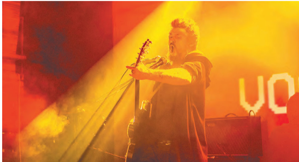
Все артисты, выходявшие на сцену, выложились на 100%

ческую поддержку оказал ПДНТ «Губерния», помогли типография «Ялта'94» и частные волонтеры. В результате организовать концерт удалось без коммерческих спонсоров, бюджет проекта составил 0 руб., а сбор средств на входе был организован уже фондом «Дедморозим».