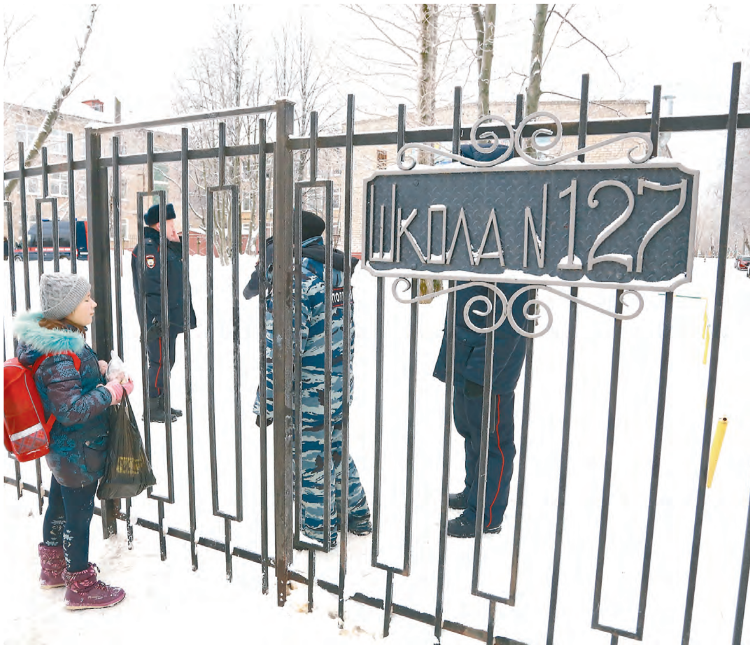
Московским следователям предстоит изучить несколько версий происшествия в пермской школе