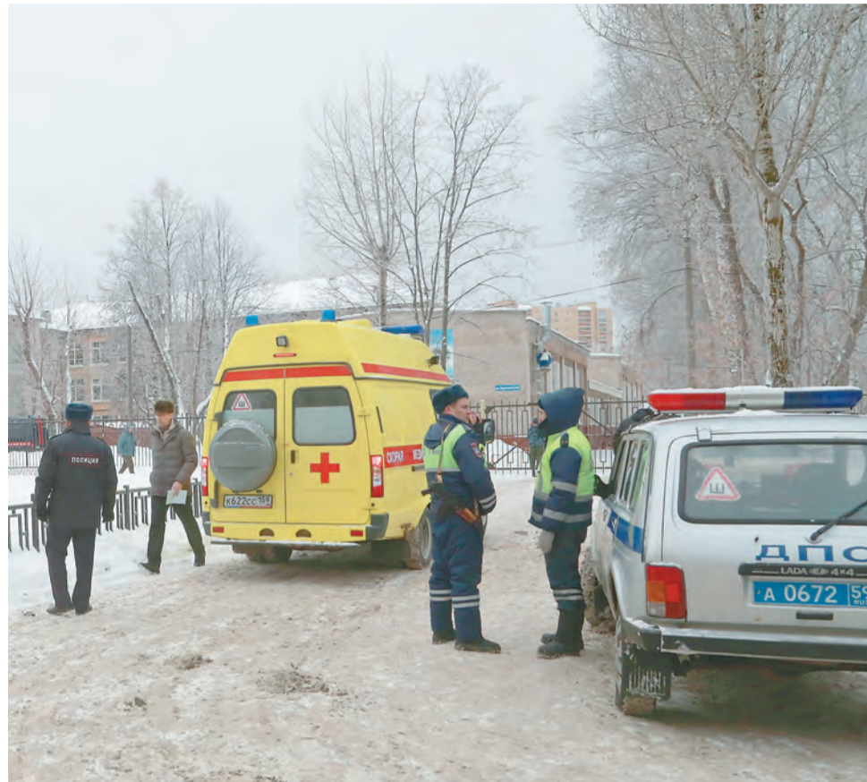
Происшествие в пермской школе получило международный резонанс: о случившемся написали CNN, BBC, Daily Mail и другие иностранные СМИ