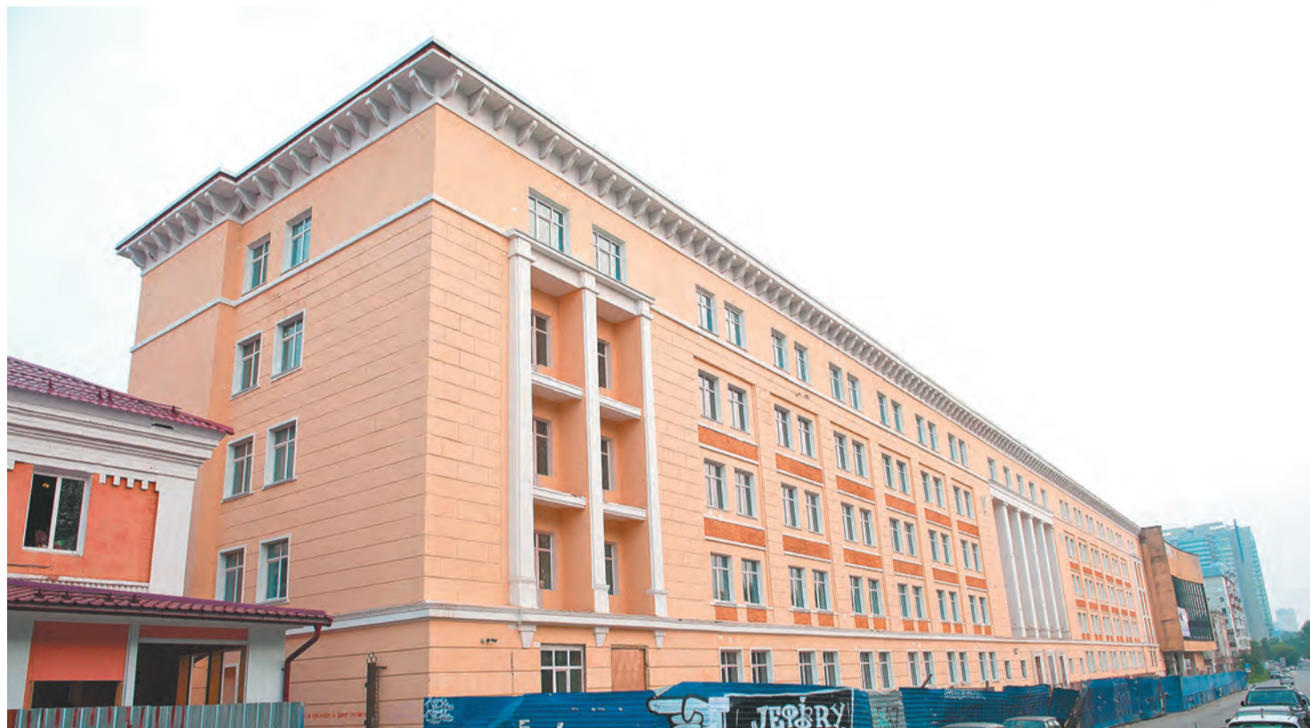
Потенциальная площадка для строительства новой гостиницы — здание бывшего ВКИУ на ул. Окулова, 4

Разница в количестве номеров обусловлена не только большим числом отелей в Екатеринбурге и Казани, но и значительным количеством крупных гостиничных комплексов, расположенных в этих городах. В Перми гостиница с фондом свыше 100 номеров всего