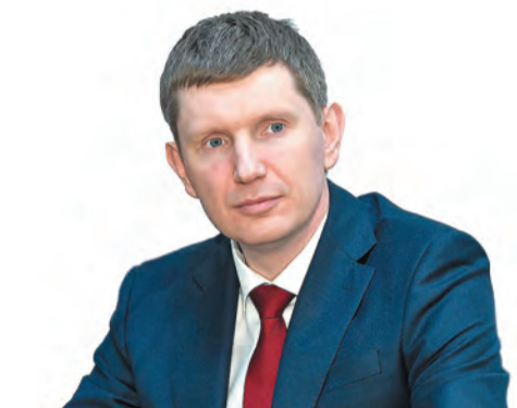
МАКСИМ РЕШЕТНИКОВ, ГУБЕРНАТОР ПЕРМСКОГО КРАЯ

Главные цитаты с итоговой пресс-конференции главы региона