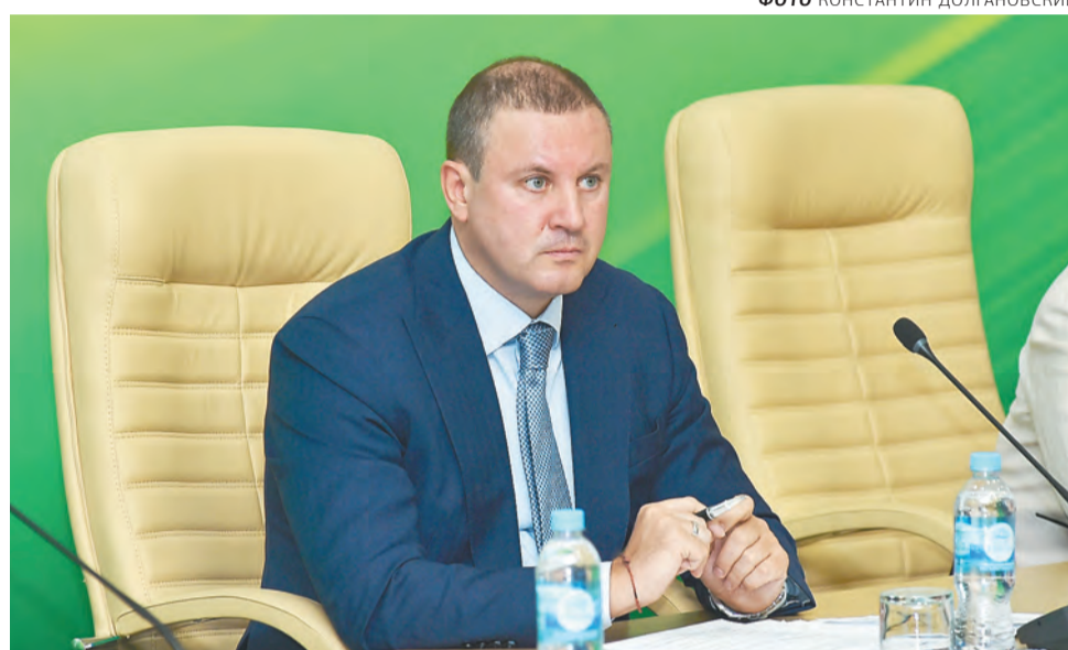
Иван Валентик, руководитель Федерального агентства лесного хозяйства

— Россия ежегодно заготавливает 200 млн куб. м леса. Из них порядка 10% приходится на Пермский край. Вроде цифра