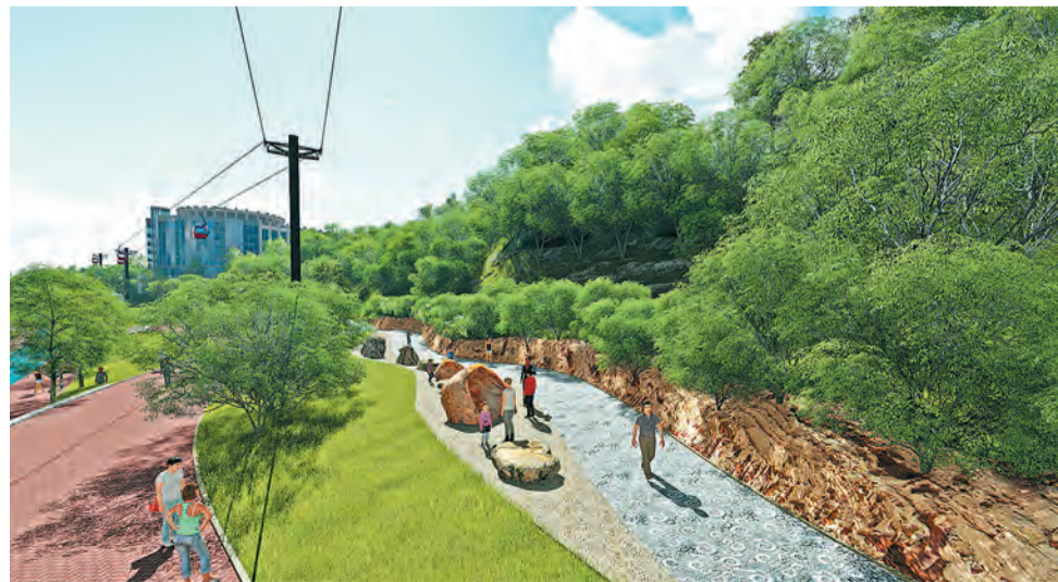
Тропа Родерика Мурчисона

На мой взгляд, стройка первогорода должна стать народной.