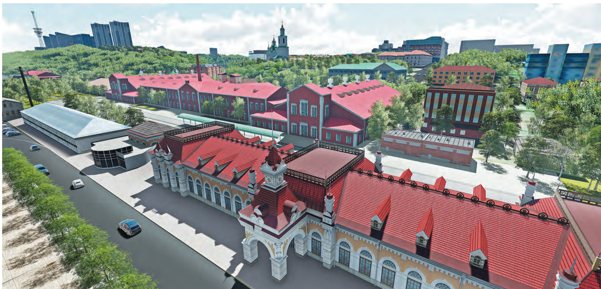
Эскиз проекта реконструкции территории завода им. Шпагина