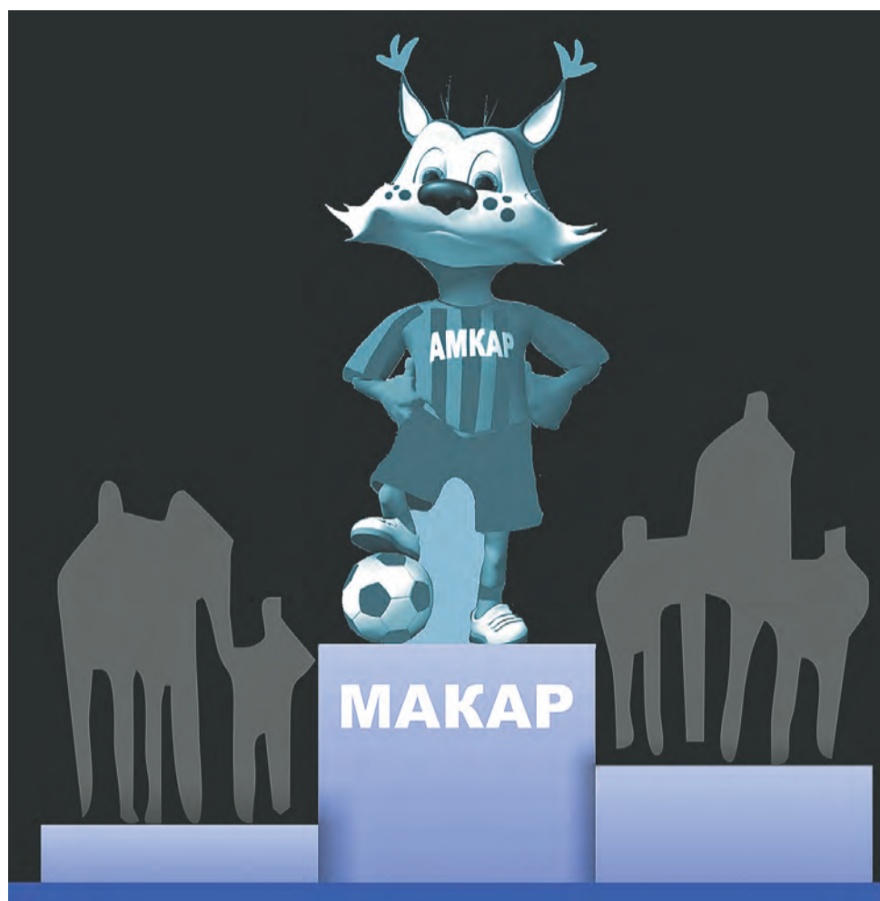
Скульптура для фотографирования — талисман футбольного клуба «Амкар» рысёнок Макара