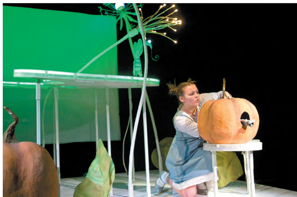
«Меня зовут Лёк»