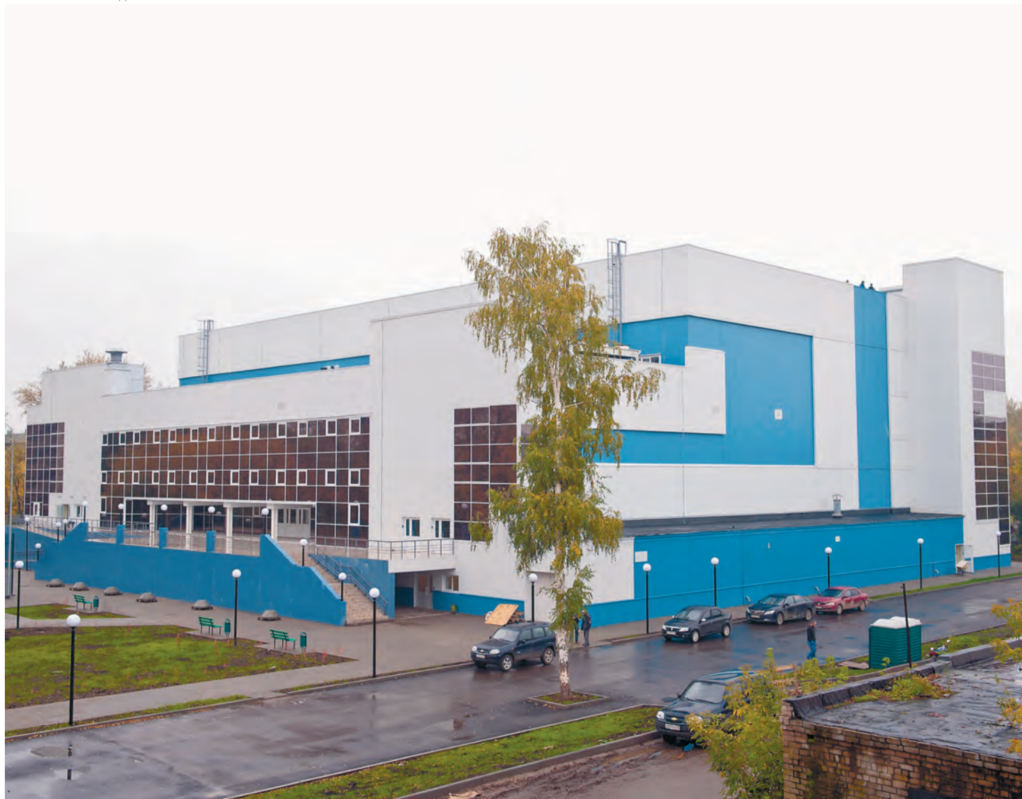
Многострадальный ФОК «Победа» долгое время был большой «головной болью» для городских властей