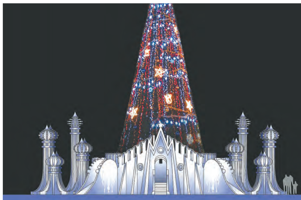
Ограждение новогодней ели посвящено чемпионату мира по футболу в 2018 году в России