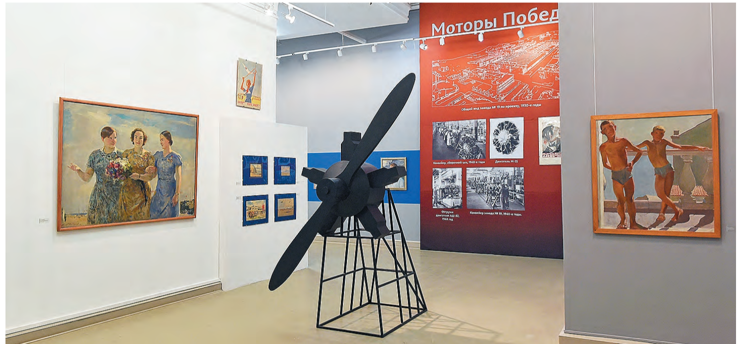
В главном зале можно увидеть шедевры соцреализма — картины Юона, Дейнеки и Герасимова

Особая страница выставки посвящена основанию завода №19, позже — завода им. Сталина, ещё позже — им. Сверд-